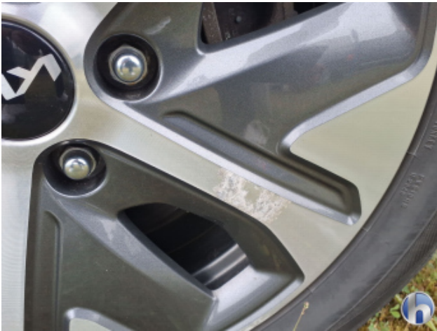
3. Felge Hinten - Links Beschädigt - Smart Repair