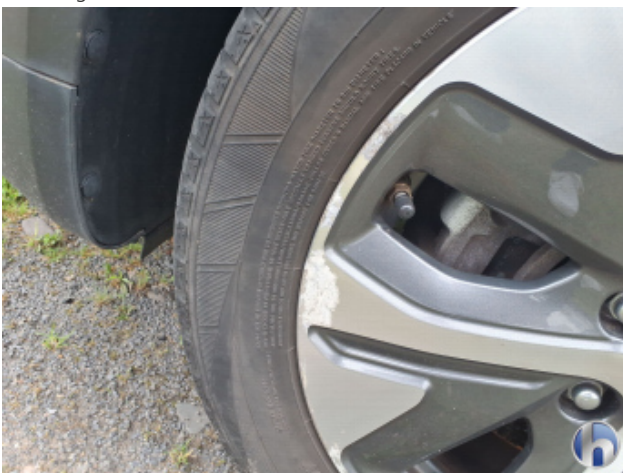
1. Felge Vorne - Links Beschädigt - Smart Repair