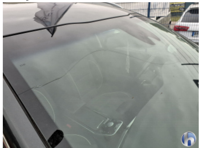
2. Windschutzscheibe Riss - Erneuern