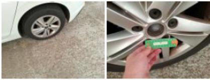
Jante alum. ARG, Griffe(s), E - Remplacer