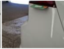
Butée cache-bagage, Manque, E - Remplacer