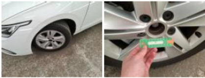
Enjoliveur de roue ARG, Manque, E - Remplacer