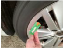
Enjoliveur de roue ARD, Manque, E - Remplacer