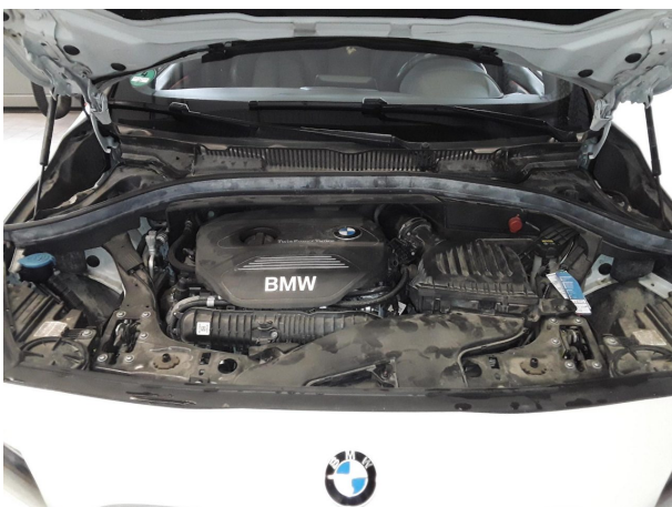
Abbildung 23: Sonstiges