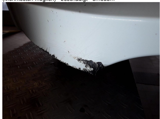
Beschädigung #4: Stossfänger vorn: Stossfänger vorn (Mehrkosten möglich) - beschädigt - erneuern