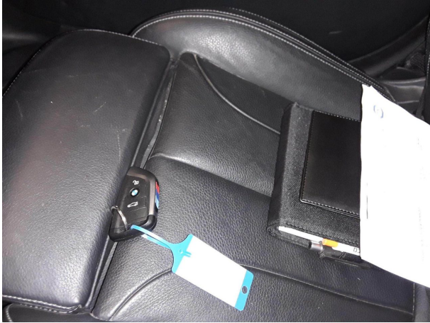
Abbildung 13: Sonstiges