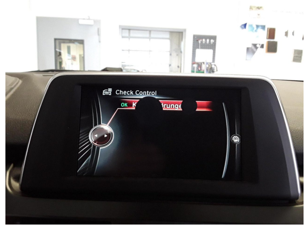
Abbildung 14: Sonstiges