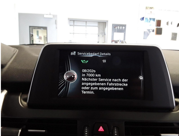
Abbildung 17: Sonstiges