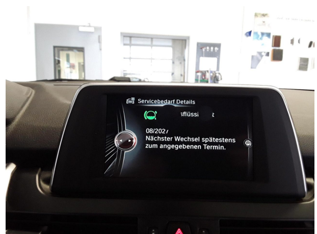
Abbildung 18: Sonstiges