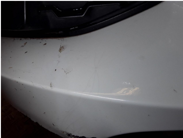
Beschädigung #4: Stossfänger vorn: Stossfänger vorn (Mehrkosten möglich) - beschädigt - erneuern