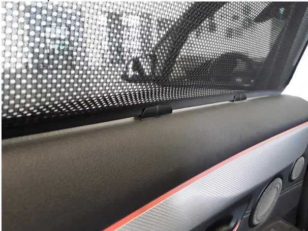
Beschädigung #2: Tür hinten links: Tür (+ rechts / Sonnenschutz / Mehrkosten möglich) - abweichend Auslieferungszustand -