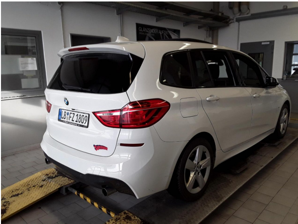
Abbildung 3: Schräg hinten (rechts)