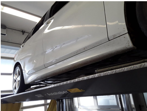
Abbildung 27: Sonstiges