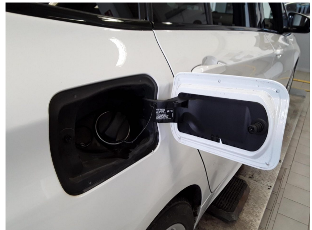
Abbildung 22: Sonstiges