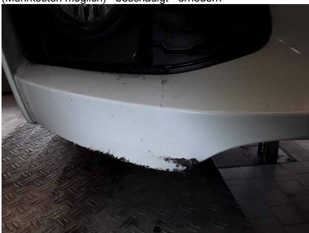
Beschädigung #4: Stossfänger vorn: Stossfänger vorn (Mehrkosten möglich) - beschädigt - erneuern