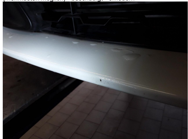
Beschädigung #4: Stossfänger vorn: Stossfänger vorn (Mehrkosten möglich) - beschädigt - erneuern