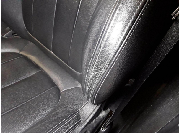
Beschädigung #1: Sitz vorn: Lehnenbezug links - verschlissen - Smart Repair