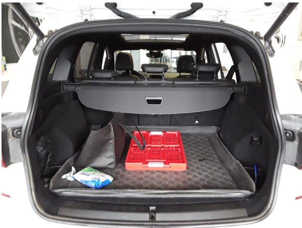
Abbildung 21: Sonstiges