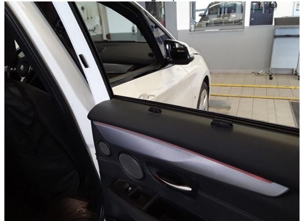
Beschädigung #2: Tür hinten links: Tür (+ rechts / Sonnenschutz / Mehrkosten möglich) - abweichend