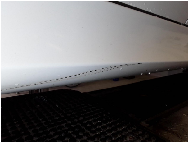
Beschädigung #3: Schweller rechts: Verkleidung - verkratzt / verschürft - lackieren