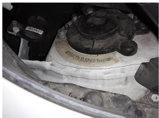
Abbildung 12: FIN