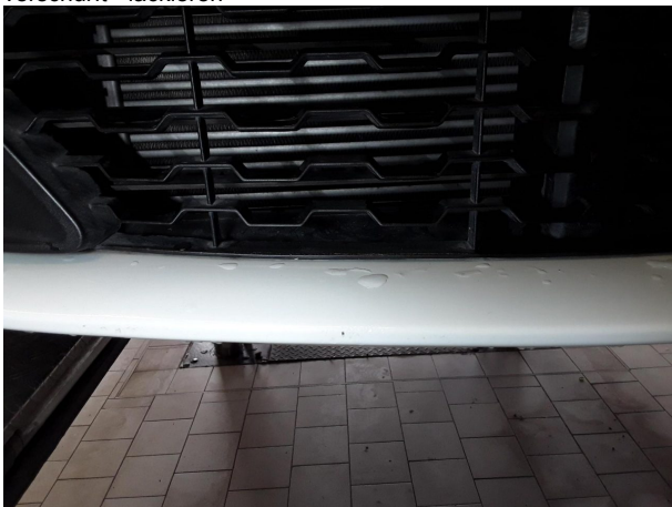
Beschädigung #4: Stossfänger vorn: Stossfänger vorn (Mehrkosten möglich) - beschädigt - erneuern