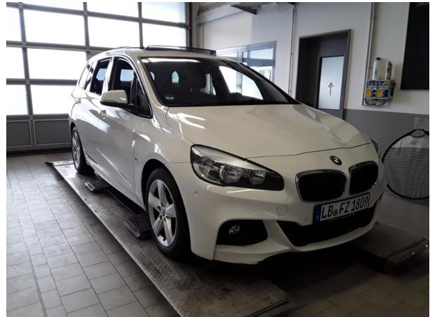
Abbildung 4: Schräg vorne (rechts)