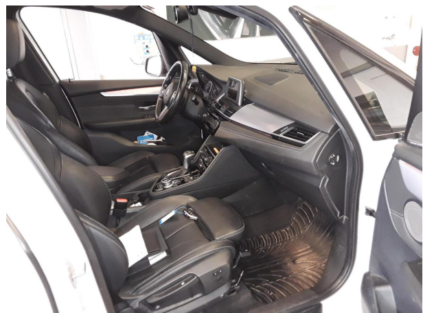
Abbildung 6: Innenraum vorne