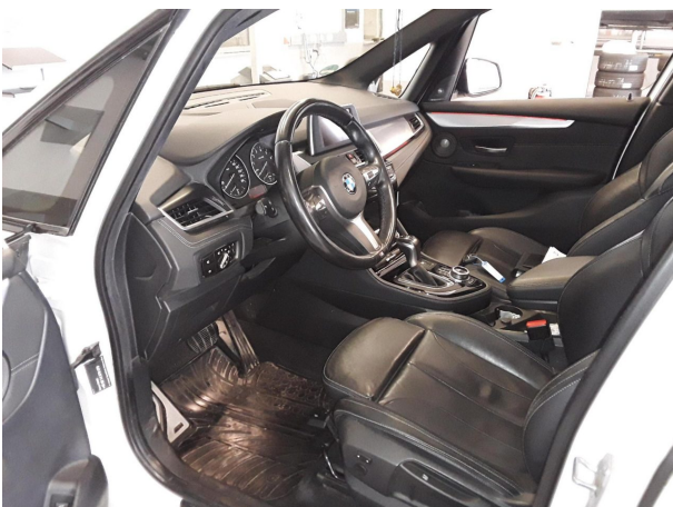
Abbildung 5: Innenraum vorne