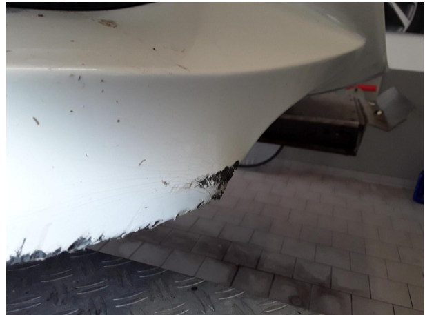
Beschädigung #4: Stossfänger vorn: Stossfänger vorn (Mehrkosten möglich) - beschädigt - erneuern