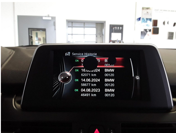
Abbildung 15: Sonstiges