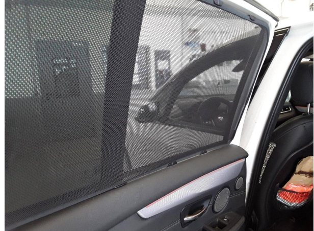
Beschädigung #2: Tür hinten links: Tür (+ rechts / Sonnenschutz / Mehrkosten möglich) - abweichend