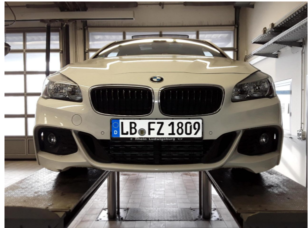
Beschädigung #4: Stossfänger vorn: Stossfänger vorn (Mehrkosten möglich) - beschädigt - erneuern