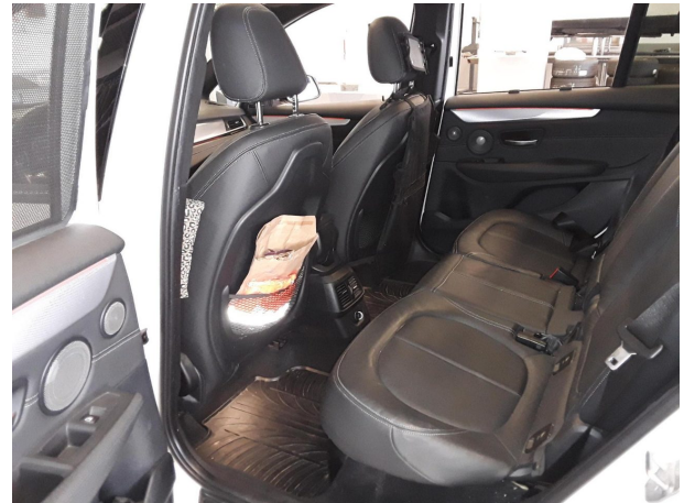
Abbildung 20: Sonstiges