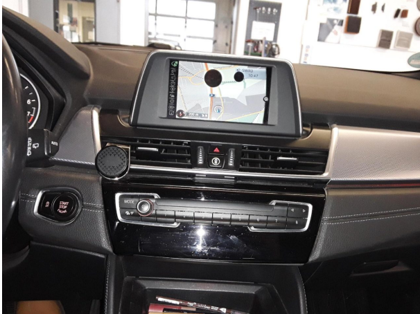
Abbildung 7: Kombiinstrument