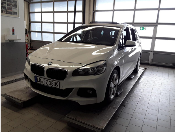
Abbildung 1: Schräg vorne (links)