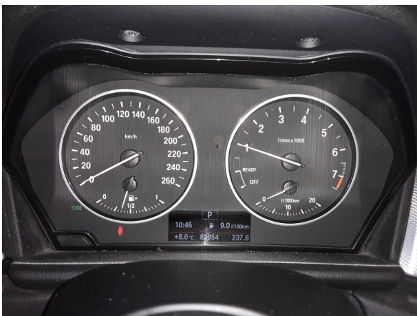
Abbildung 9: Laufeistung