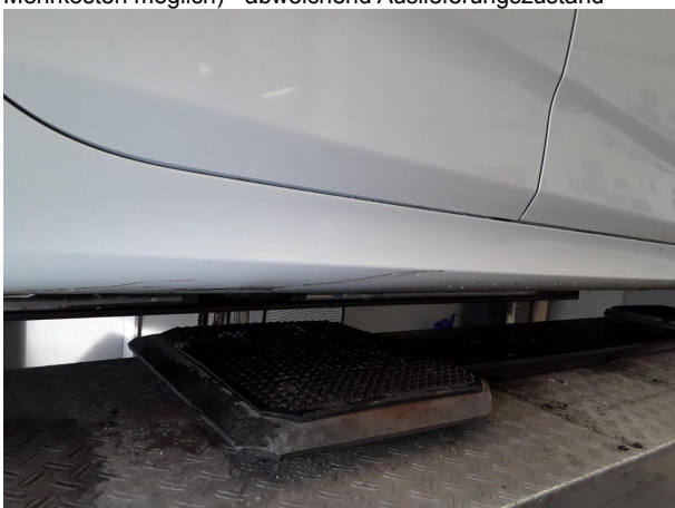
Beschädigung #3: Schweller rechts: Verkleidung - verkratzt / verschürft - lackieren