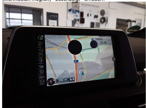
Beschädigung #5: Multimediasystem: Bildschirm (Mehrkosten möglich) - abweichend Auslieferungszustand - erneuern