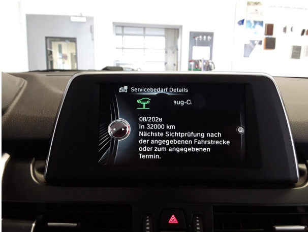
Abbildung 19: Sonstiges