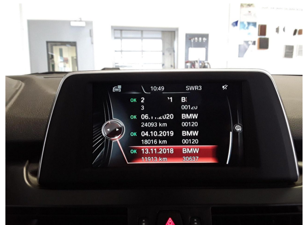
Abbildung 16: Sonstiges