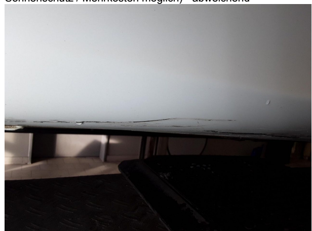
Beschädigung #3: Schweller rechts: Verkleidung - verkratzt / verschürft - lackieren