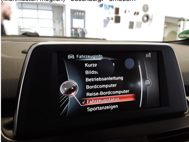
Beschädigung #5: Multimediasystem: Bildschirm (Mehrkosten möglich) - abweichend Auslieferungszustand - erneuern