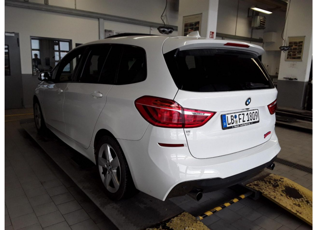
Abbildung 2: Schräg hinten (links)