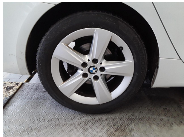
Abbildung 10: Montierte Bereifung