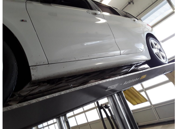
Abbildung 26: Sonstiges