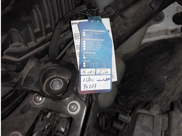
Abbildung 25: Sonstiges