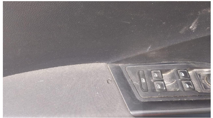
WhatsApp Image 2026-05-12 at 12.47.18.jpeg