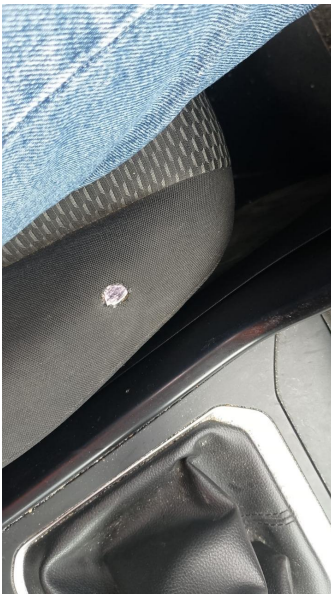
WhatsApp Image 2026-05-12 at 12.47.19 (1).jpeg