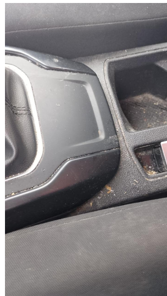
WhatsApp Image 2026-05-12 at 12.47.19 (3).jpeg