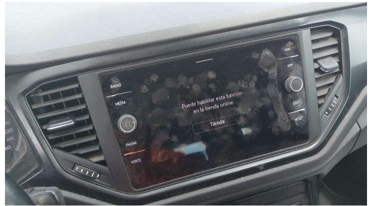
WhatsApp Image 2026-05-12 at 12.47.19 (4).jpeg