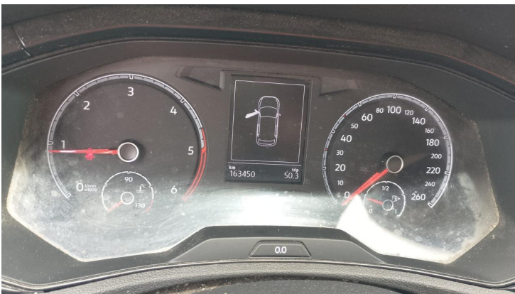
WhatsApp Image 2026-05-12 at 12.47.19.jpeg