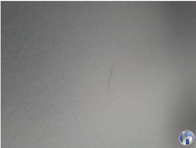
2. Dachhimmel Verschmutzt - Reinigen