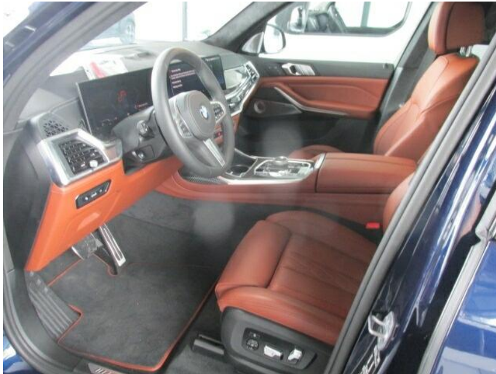
Bild 7 : Durch geöffnete Fahrertüre: Fahrersitz, Armaturenbrett und Schalthebel