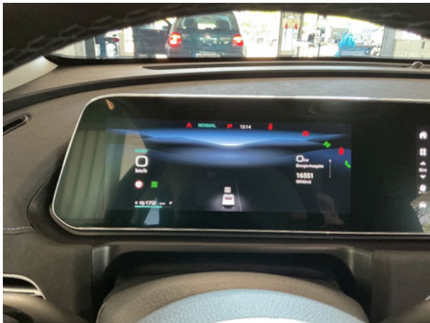
Abbildung 9: Kombiinstrument