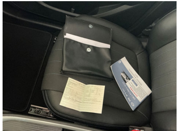
Abbildung 16: Sonstiges