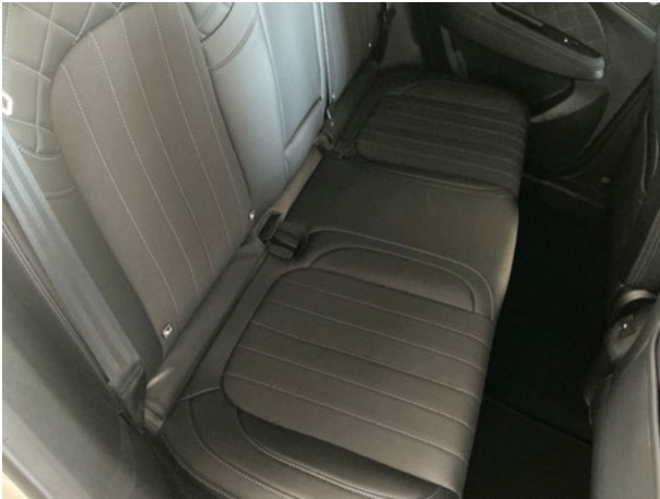
Abbildung 13: Innenraum hinten