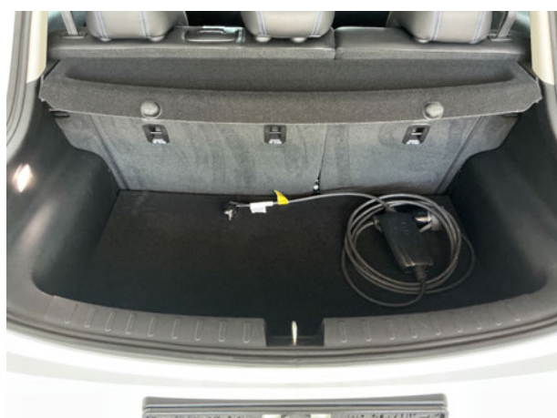
Abbildung 5: Laderaum