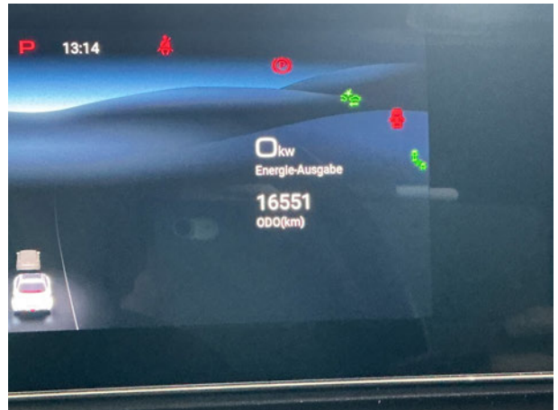
Abbildung 10: Laufleistung