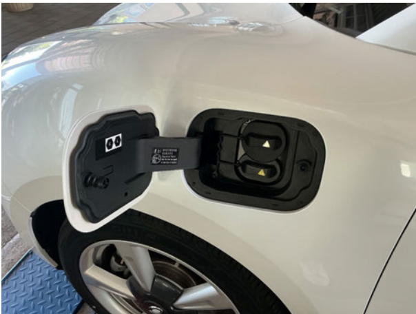
Abbildung 15: Ladebuchse/Tankstutzen