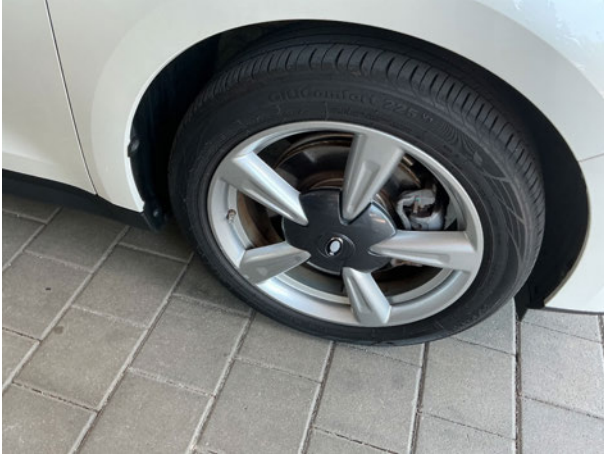
Beschädigung #1: Rad/Reifen: Leichtmetallfelge vorn rechts - verkratzt / verschürft - Wertminderung