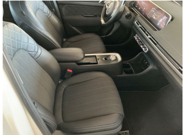
Abbildung 8: Innenraum vorne