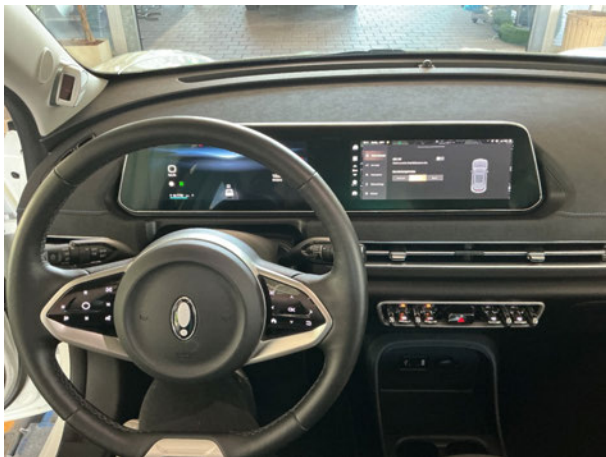
Abbildung 11: Instrumententafel