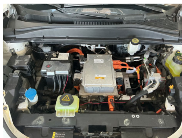
Abbildung 6: Motorraum