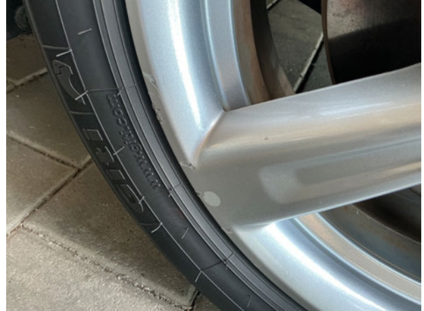
Beschädigung #1: Rad/Reifen: Leichtmetallfelge vorn rechts - verkratzt / verschürft - Wertminderung