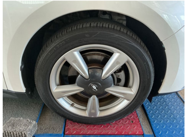
Abbildung 14: Montierte Bereifung