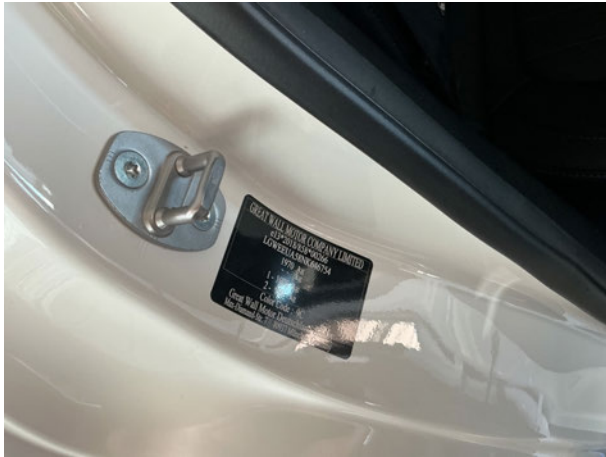
Abbildung 7: FIN