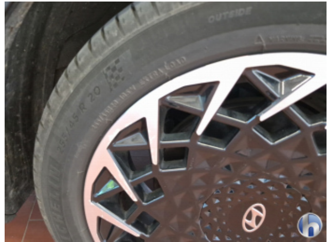
1. Felge Vorne - Rechts Korrodiert - Smart Repair