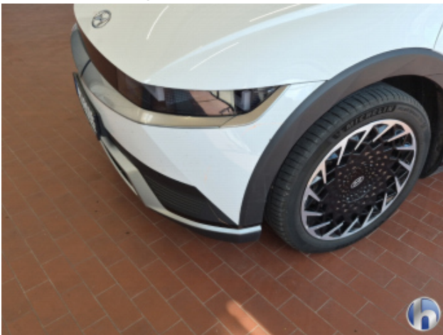
5. Stoßfänger Vorne Abschürfung - Smart Repair