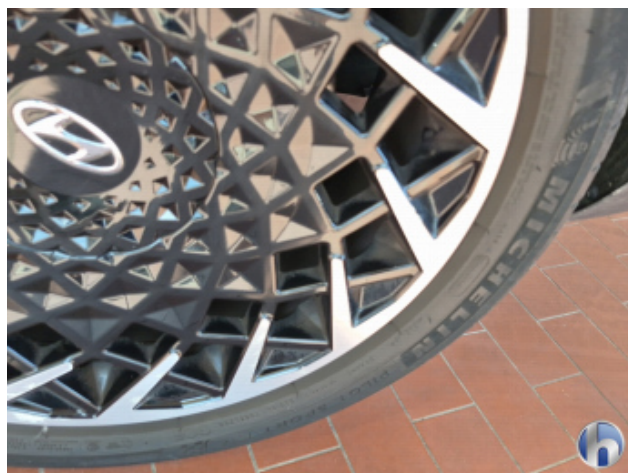
3. Felge Hinten - Links Korrodiert - Smart Repair