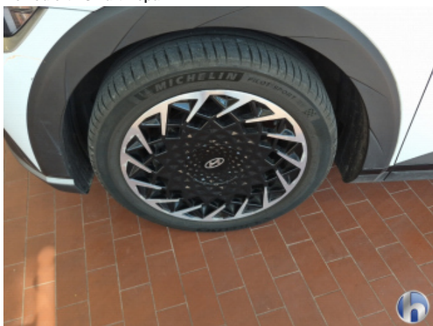
4. Felge Vorne - Links Korrodiert - Smart Repair