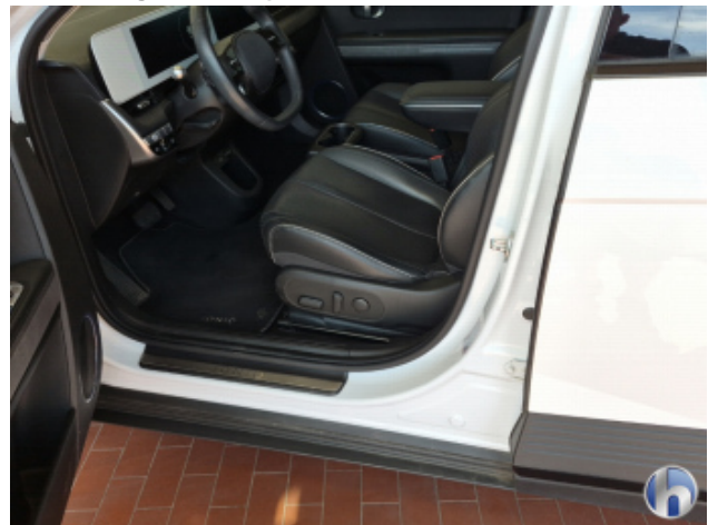
6. Türeinstieg Vorne - Links Beschädigt - Smart Repair