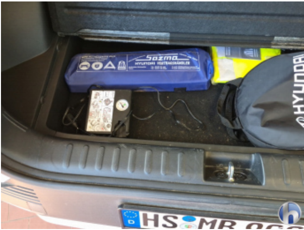
8. Tire-fit Füllmittel Fehlt - Erneuern