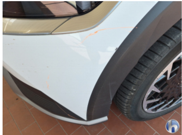
5. Stoßfänger Vorne Abschürfung - Smart Repair