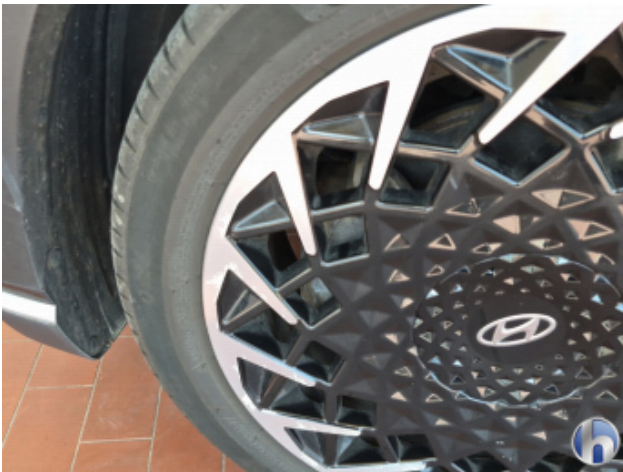
4. Felge Vorne - Links Korrodiert - Smart Repair