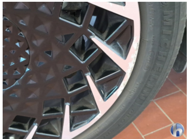
2. Felge Hinten - Rechts Korrodiert - Smart Repair