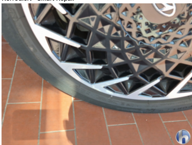
3. Felge Hinten - Links Korrodiert - Smart Repair