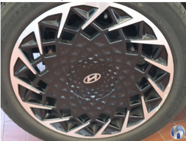
2. Felge Hinten - Rechts Korrodiert - Smart Repair