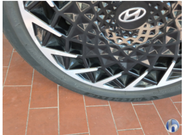
4. Felge Vorne - Links Korrodiert - Smart Repair