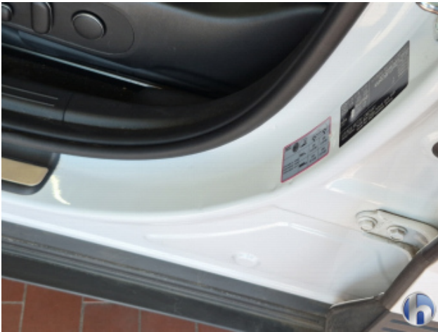
6. Türeinstieg Vorne - Links Beschädigt - Smart Repair