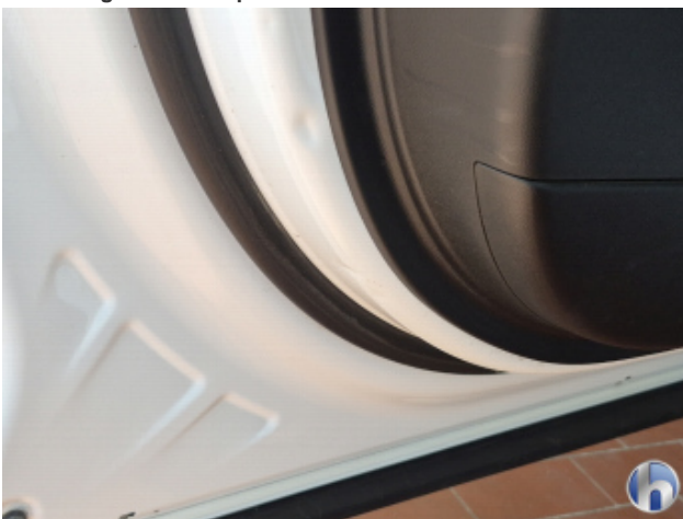
7. Tür Vorne - Links Beschädigt - Smart Repair