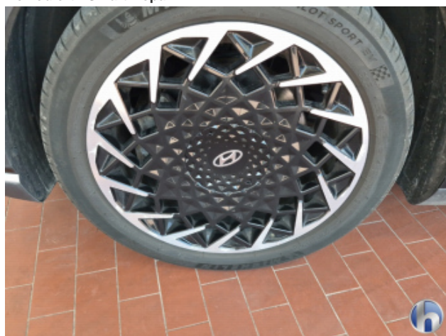
4. Felge Vorne - Links Korrodiert - Smart Repair