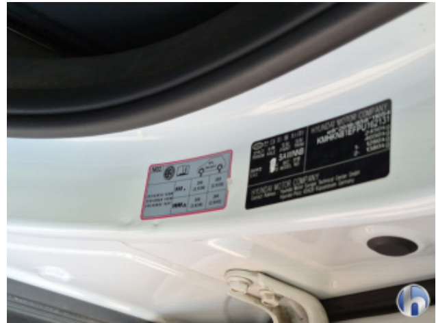
6. Türeinstieg Vorne - Links Beschädigt - Smart Repair