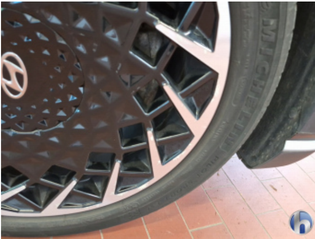
1. Felge Vorne - Rechts Korrodiert - Smart Repair