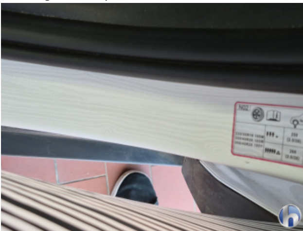
6. Türeinstieg Vorne - Links Beschädigt - Smart Repair