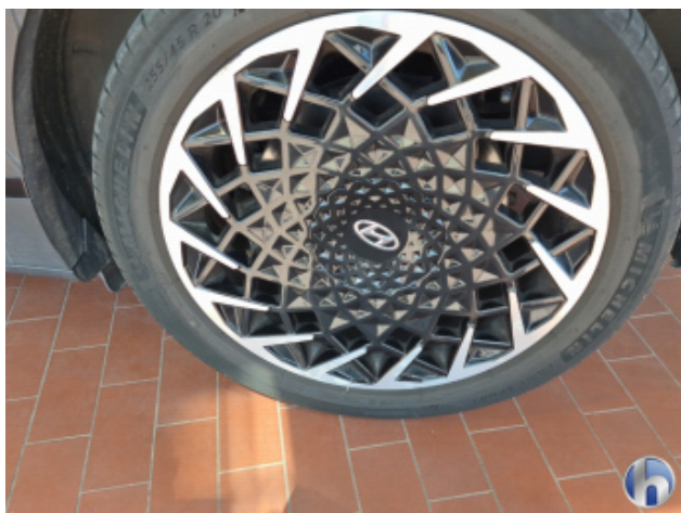
3. Felge Hinten - Links Korrodiert - Smart Repair