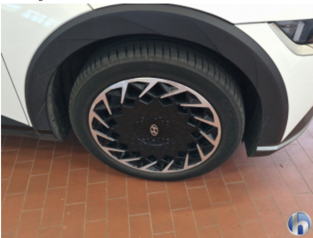
1. Felge Vorne - Rechts Korrodiert - Smart Repair