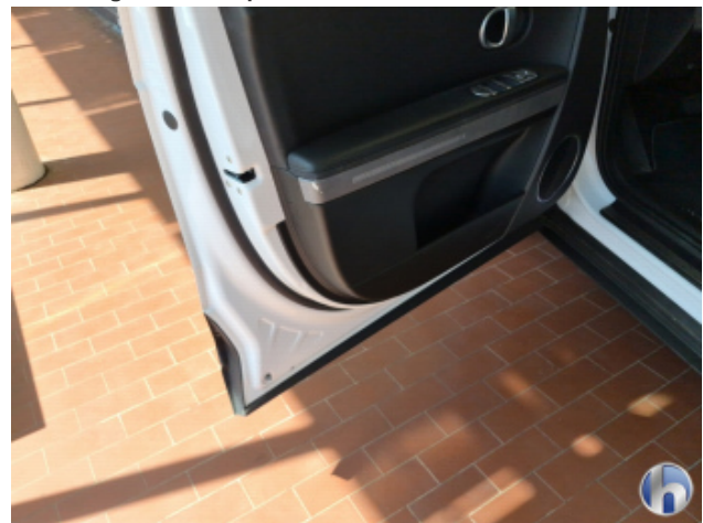
7. Tür Vorne - Links Beschädigt - Smart Repair