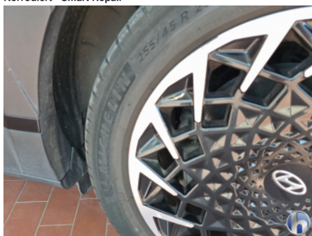
3. Felge Hinten - Links Korrodiert - Smart Repair