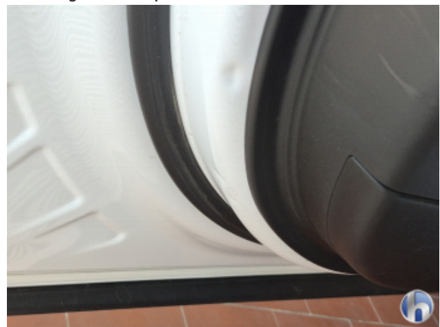
7. Tür Vorne - Links Beschädigt - Smart Repair