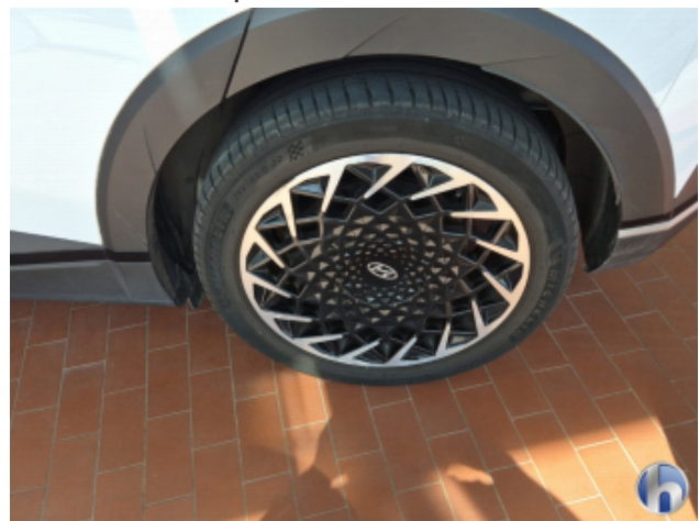
3. Felge Hinten - Links Korrodiert - Smart Repair