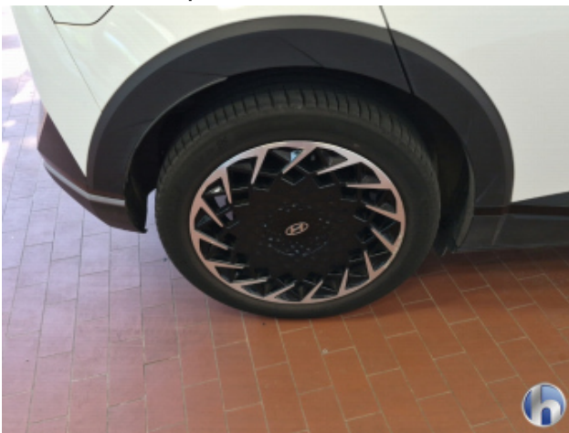
2. Felge Hinten - Rechts Korrodiert - Smart Repair