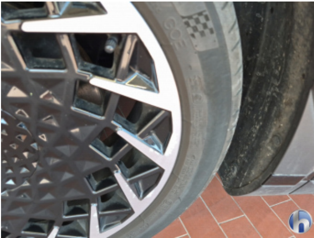
4. Felge Vorne - Links Korrodiert - Smart Repair