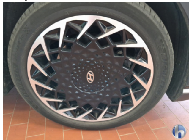
1. Felge Vorne - Rechts Korrodiert - Smart Repair