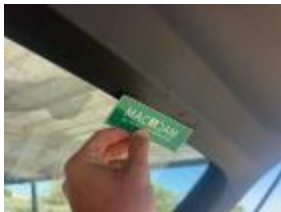
Guarnic Tapa Tras Rayado Reemplazar