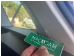
Tapa Interior Pequeña Roto Reemplazar