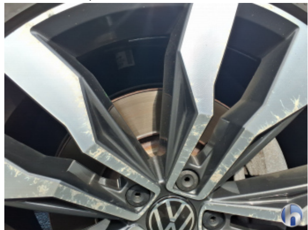
5. Felge Vorne - Rechts Kratzer - Smart Repair