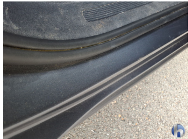
7. Tür Hinten - Rechts Kratzer - Lackieren