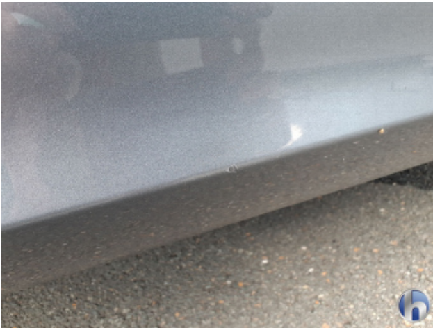
3. Schweller - Rechts Kratzer - Smart Repair