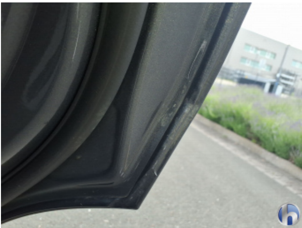
7. Tür Hinten - Rechts Kratzer - Lackieren