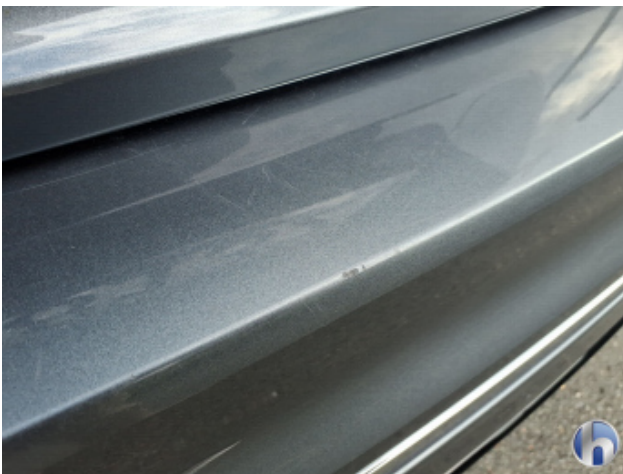
2. Stoßfänger Hinten Kratzer - Lackieren