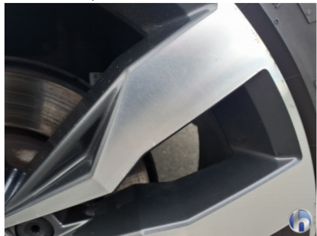
8. Felge Hinten - Links Kratzer - Smart Repair