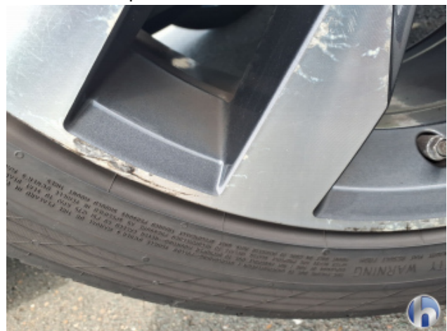
5. Felge Vorne - Rechts Kratzer - Smart Repair