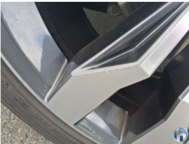
8. Felge Hinten - Links Kratzer - Smart Repair