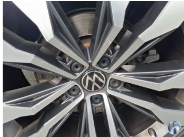
9. Felge Hinten - Rechts Kratzer - Smart Repair