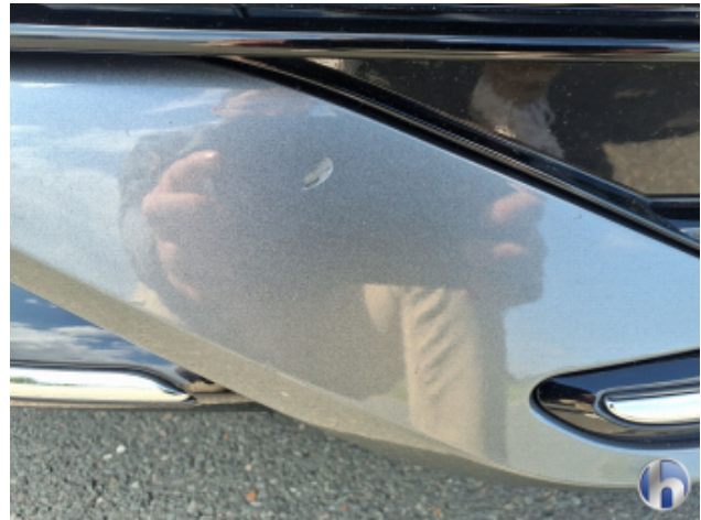
4. Stoßfänger Vorne Kratzer - Smart Repair