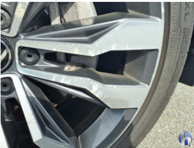
5. Felge Vorne - Rechts Kratzer - Smart Repair