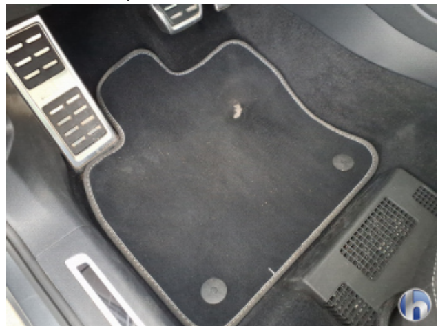
11. Fußraum Innenraum links vorne Loch - Erneuern