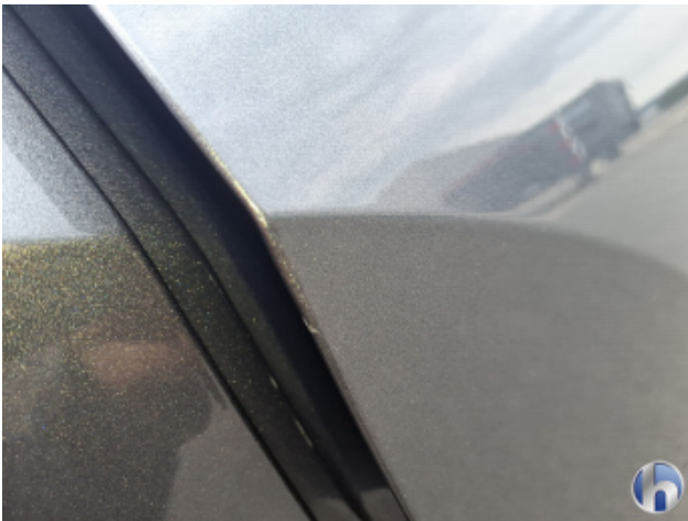
7. Tür Hinten - Rechts Kratzer - Lackieren