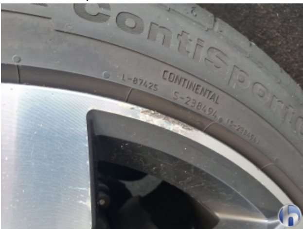
9. Felge Hinten - Rechts Kratzer - Smart Repair