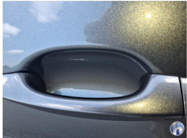
6. Tür Vorne - Links Oberflächenkratzer - Aufbereiten / Polieren