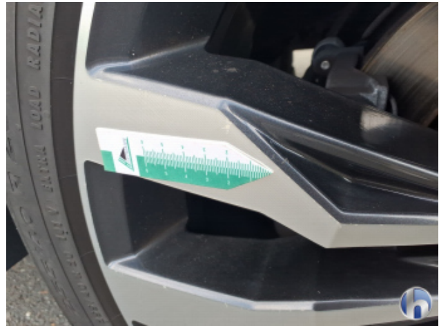
8. Felge Hinten - Links Kratzer - Smart Repair