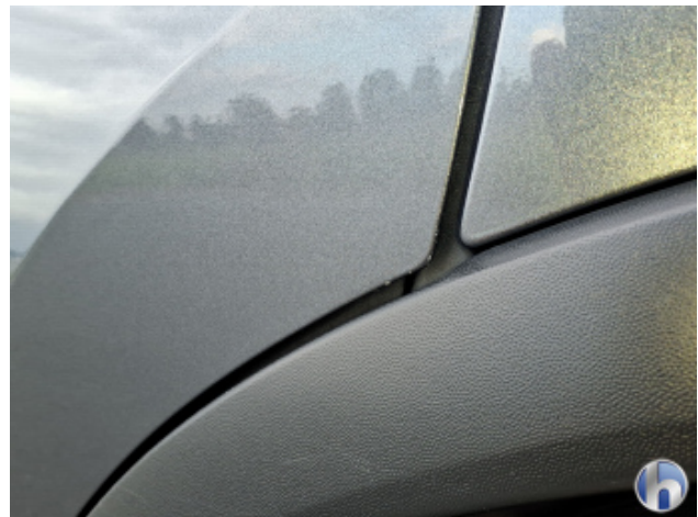
1. Tür Hinten - Links Kratzer - Smart Repair