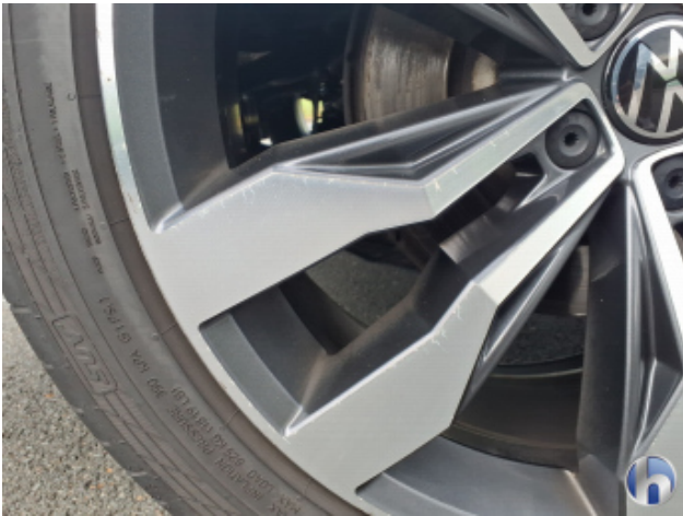
9. Felge Hinten - Rechts Kratzer - Smart Repair