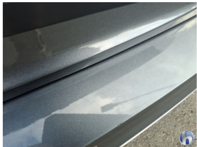
2. Stoßfänger Hinten Kratzer - Lackieren