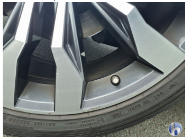
9. Felge Hinten - Rechts Kratzer - Smart Repair