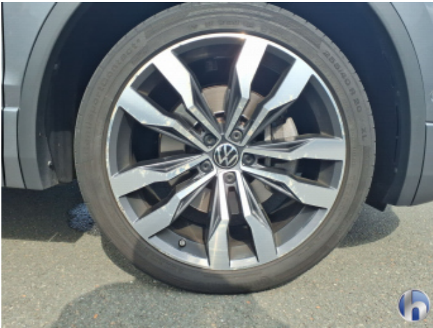
5. Felge Vorne - Rechts Kratzer - Smart Repair