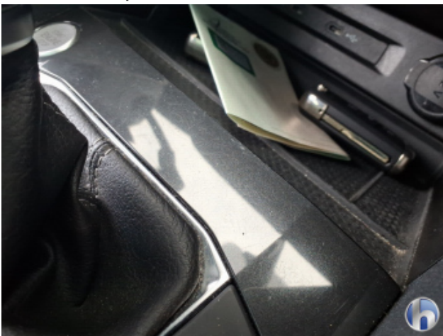
10. Mittelkonsole Innenraum vorne mitte Kratzer - Smart Repair