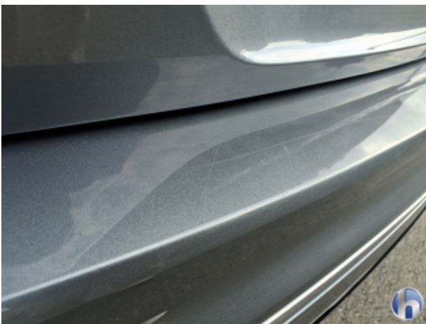
2. Stoßfänger Hinten Kratzer - Lackieren