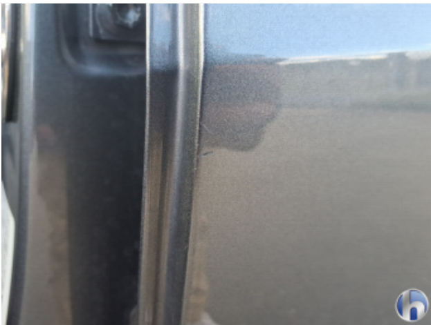
1. Tür Hinten - Links Kratzer - Smart Repair