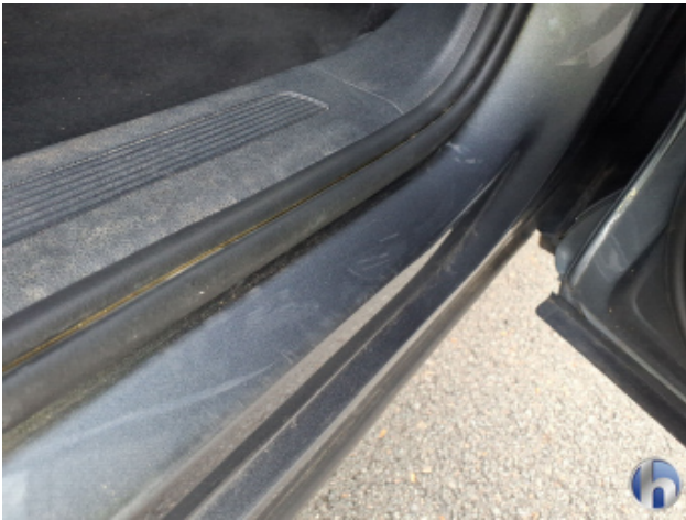
7. Tür Hinten - Rechts Kratzer - Lackieren