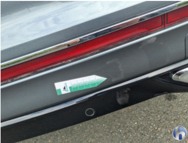
2. Stoßfänger Hinten Kratzer - Lackieren