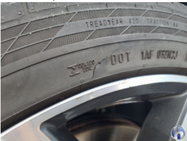
12. Reifen Vorne - Links Kratzer - Erneuern