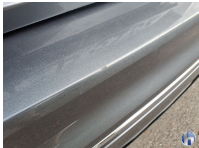
2. Stoßfänger Hinten Kratzer - Lackieren