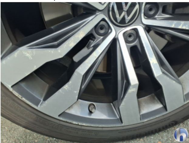
5. Felge Vorne - Rechts Kratzer - Smart Repair