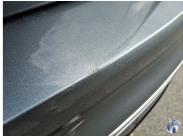
2. Stoßfänger Hinten Kratzer - Lackieren