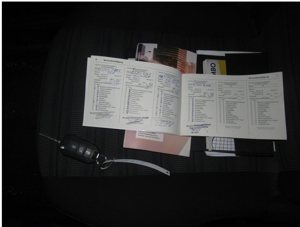
Bild 5 : Schlüssel und ggfls. Serviceheft, Navi-CD Nur 1 Schlüssel vorgelegt ( Schließsatz )