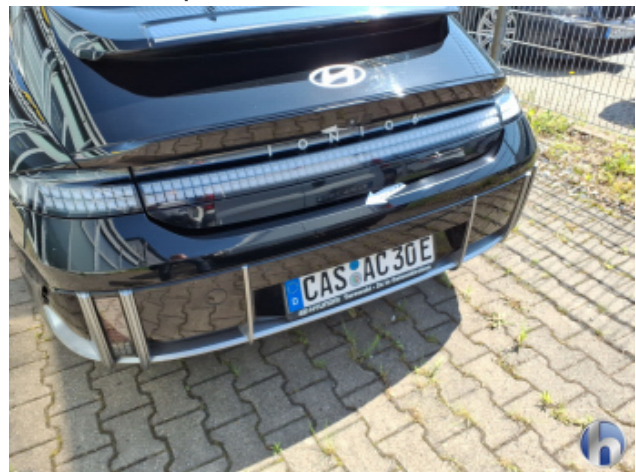
3. Stoßfänger Hinten Kratzer - Smart Repair