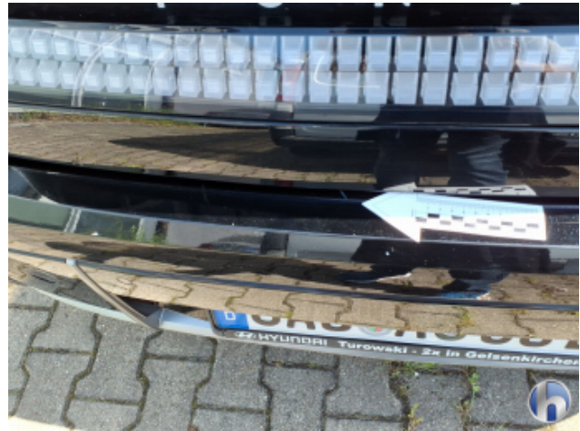
3. Stoßfänger Hinten Kratzer - Smart Repair