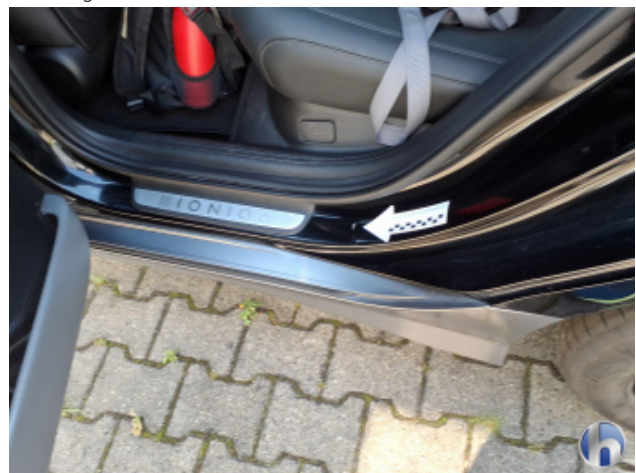
1. Schweller - Links Kratzer - Smart Repair