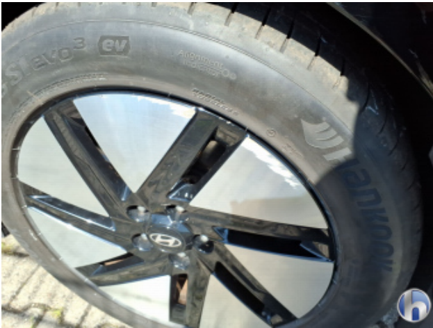
2. Felge Vorne - Rechts Kratzer - Smart Repair