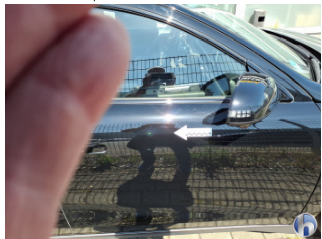
4. Tür Vorne - Rechts Kratzer - Smart Repair