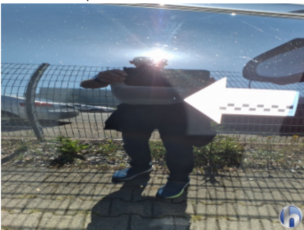
4. Tür Vorne - Rechts Kratzer - Smart Repair