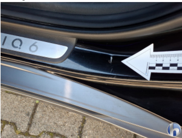
1. Schweller - Links Kratzer - Smart Repair