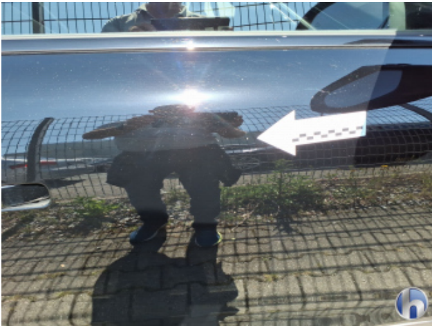
4. Tür Vorne - Rechts Kratzer - Smart Repair