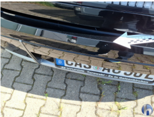
3. Stoßfänger Hinten Kratzer - Smart Repair