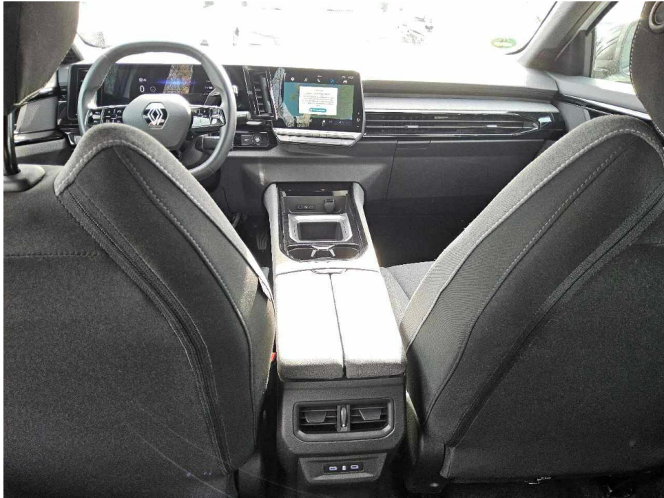
Bild 7 : Mittelkonsole des Rücksitzes (Radio/Navigation eingeschaltet)