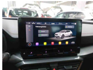
Innenraum - Navigationsgerät/Radio