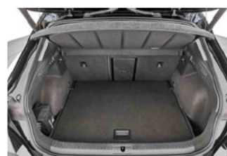
Innenraum - Kofferraum