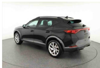
Fahrzeugansicht - diagonal hinten links