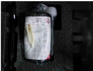
Räder - Haltbarkeitsdatum Tirefit