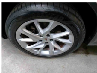
Räder - Rad montiert vorne links