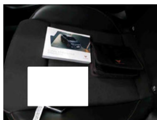
Equipment - Boardmappe/ Securitybag