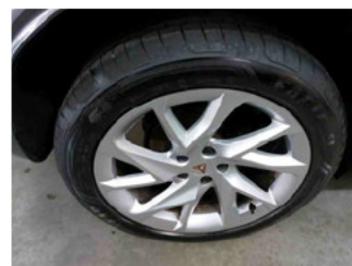
Räder - Rad montiert hinten rechts