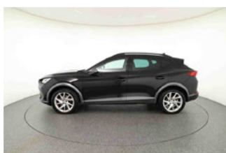
Seitenansicht - Schweller links