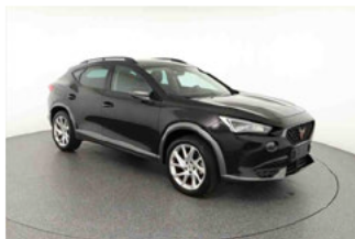
Fahrzeugansicht - diagonal vorne rechts