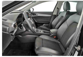
Innenraum - vorne