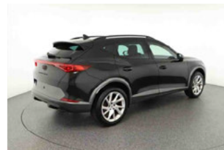
Fahrzeugansicht - diagonal hinten rechts