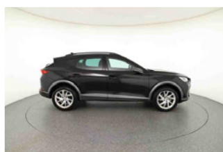
Seitenansicht - Schweller rechts