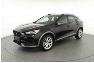
Fahrzeugansicht - diagonal vorne links

Auftrags-Nr: 1002239668 Besichtigt am: 17.12.2025 11:44 Berichts-Nr: 9723333 FIN: VSSZZZKM1RR028558