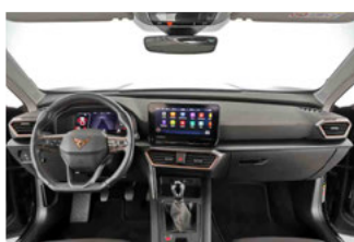
Innenraum - Mittelkonsole