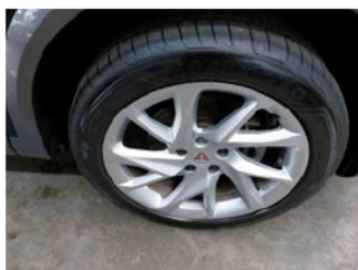
Räder - Rad montiert vorne rechts