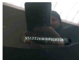
Fahrzeug - Typenschild/Fahrgestellnummer