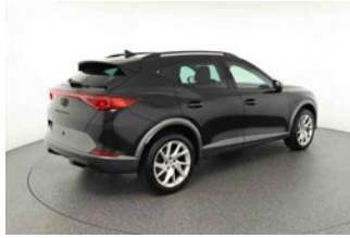
Fahrzeugansicht - diagonal hinten rechts