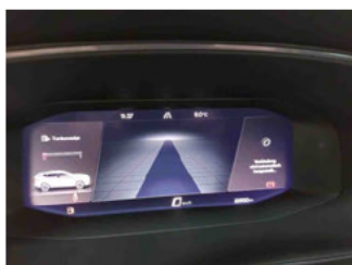
Innenraum - Cockpit mit Laufleistung