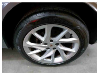
Räder - Rad montiert hinten links