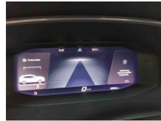
Innenraum - Cockpit mit Laufleistung