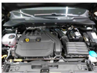
Fahrzeug - Motorraum offen