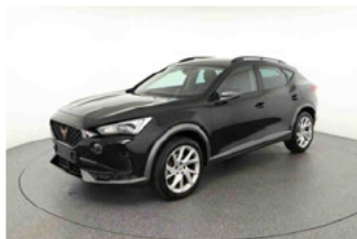
Fahrzeugansicht - diagonal vorne links