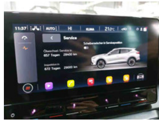
Fahrzeug - Serviceunterlagen / Wartungsnachweis