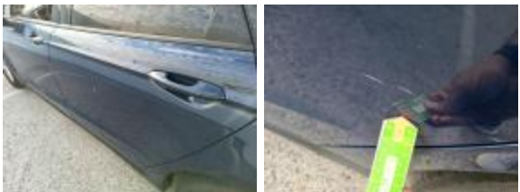
Puerta Delant Iz Rayado Reparar + Pintar