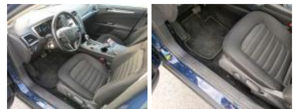
Tapizado Asiento Del IZ Quemado Reemplazar