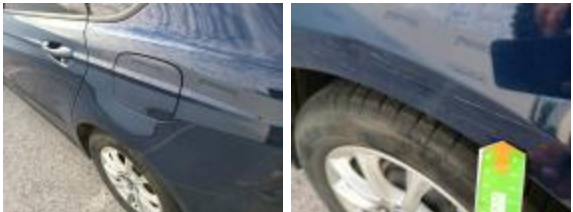
Puerta Tras Iz Rayado Reparar + Pintar