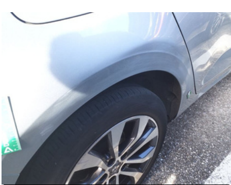
Aile / Arrière Droit / Enfoncement