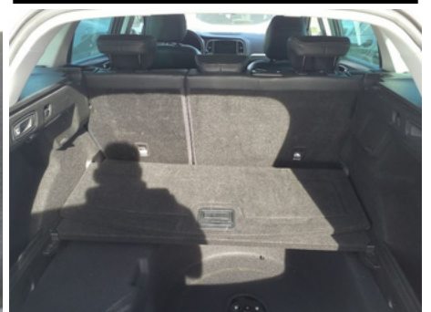
Cache bagages / - / Manquant