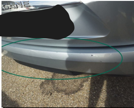
Pare-chocs / Arrière / Rayure