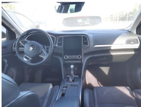
Planche de bord depuis le siège arrière