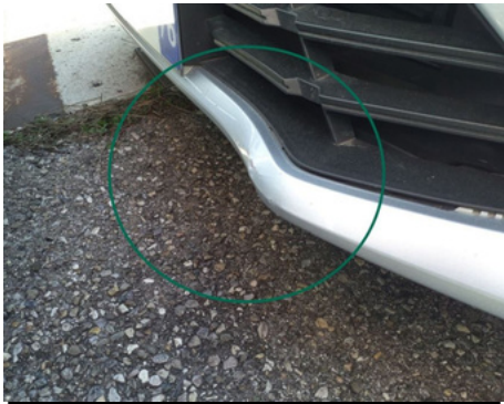
Pare-chocs / Avant / Enfoncement