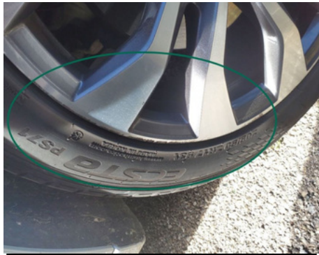
Jante / Avant Droit / Rayure