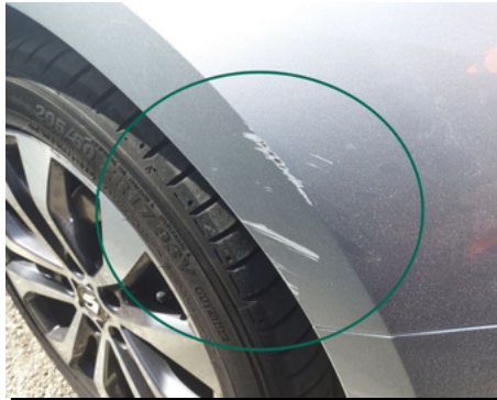
Aile / Avant Droit / Rayure