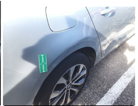
Aile / Arrière Droit / Enfoncement