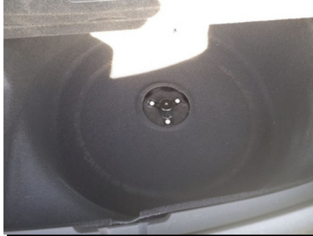
Outils de bord / - / Manquant