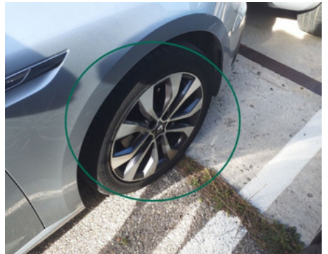
Jante / Avant Droit / Rayure