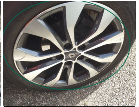
Jante / Arrière Gauche / Rayure