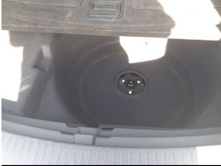
Outils de bord / - / Manquant