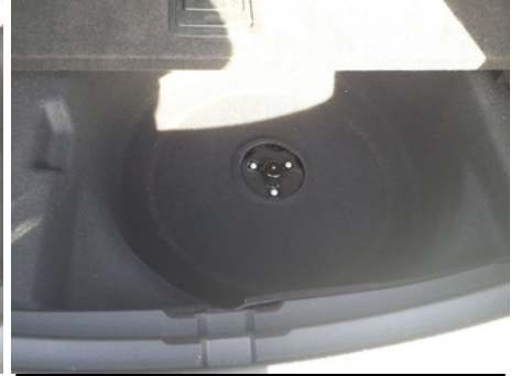
Cric / - / Manquant