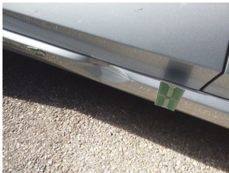
Bas de caisse / Arrière Droit / Enfoncement