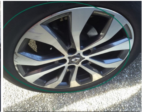
Jante / Arrière Droit / Rayure