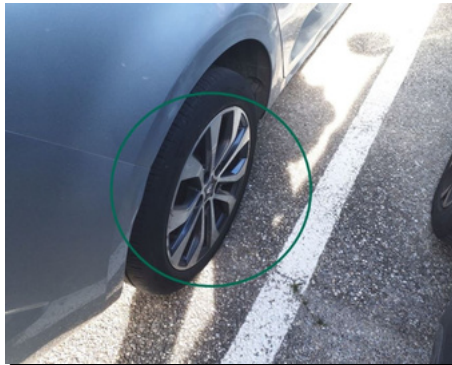
Jante / Arrière Droit / Rayure