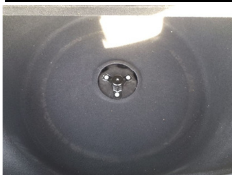
Éléments amovibles / Roue de secours