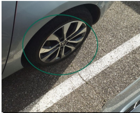
Jante / Arrière Gauche / Rayure