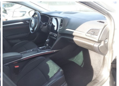
Compartiment passager avant