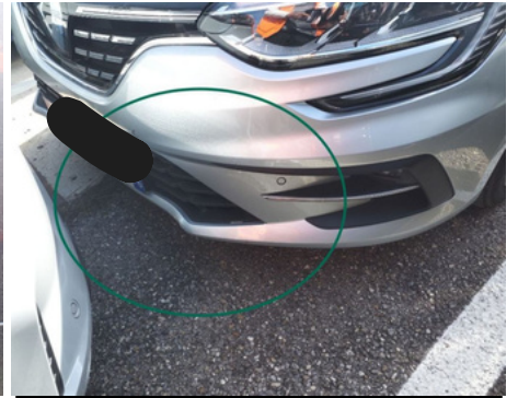
Pare-chocs / Avant / Enfoncement