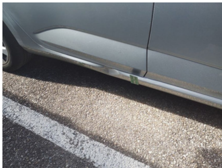
Bas de caisse / Arrière Droit / Enfoncement