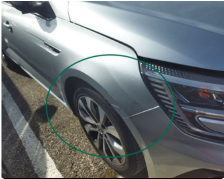
Aile / Avant Droit / Rayure