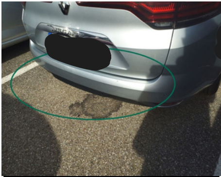
Pare-chocs / Arrière / Rayure