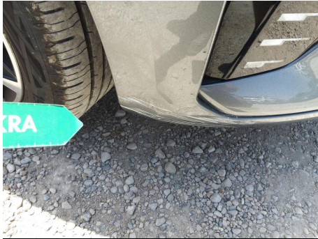
Paragolpes / Delantero / Ralladura