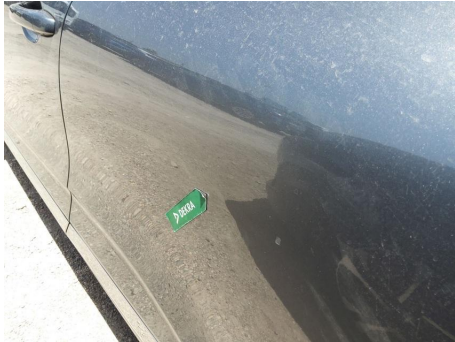
Puerta / Trasero Izquierdo / Abolladura