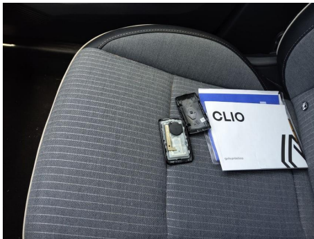
Elementos faltantes / Manual de instrucciones