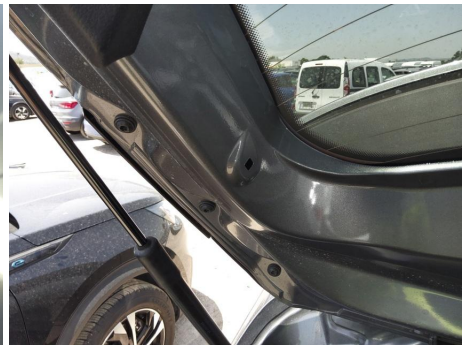
Pivotes de Bandeja Trasera / Izquierda / Faltante