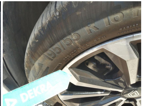
Llanta / Delantero izquierdo / Ralladura