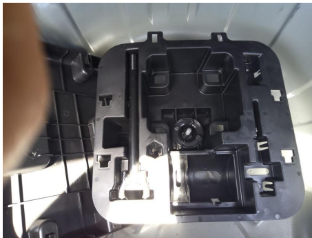
Rellenar kit de emergencia / - / Faltante