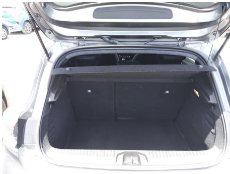
Elementos faltantes / Cubierta de carga