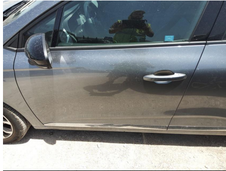
Puerta / Delantero Izquierdo / Abolladura