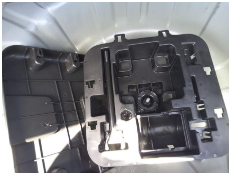
Kit de reparación de neumáticos de compresor / - / Faltante