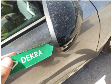
Carcasa del espejo de la puerta exterior / Derecha / Ralladura