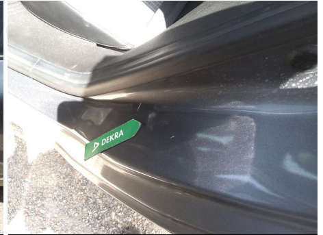
Travesaño de la puerta / Trasero Izquierdo / Abolladura