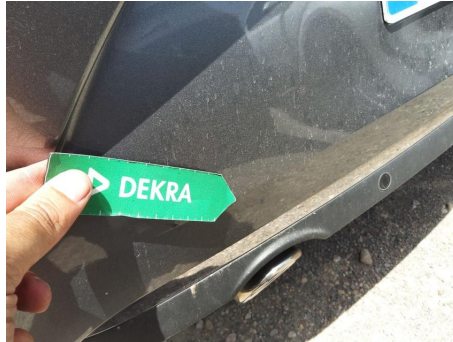
Paragolpes / Trasero / Ralladura