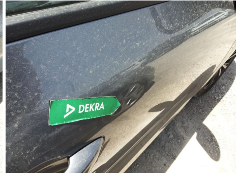
Puerta / Delantero Derecho / Abolladura