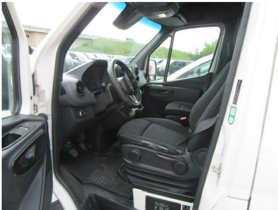
Bild 8 : Durch geöffnete Fahrertüre: Fahrersitz, Armaturenbrett und Schalthebel