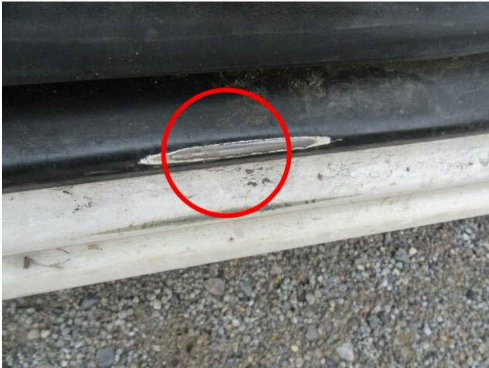
Bild 13 : Einstige vorne links Lackabtragung Folie Einstieg vorne links schadhaft