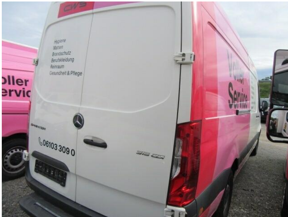
Bild 3 : Diagonal hinten rechts