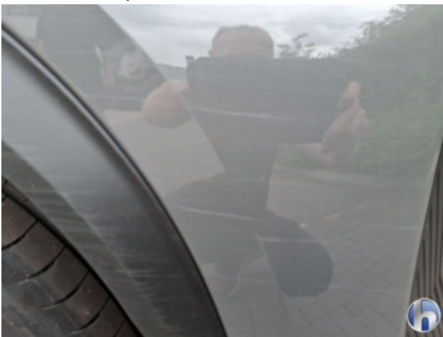
3. Stoßfänger Vorne Oberflächenkratzer - Aufbereiten / Polieren