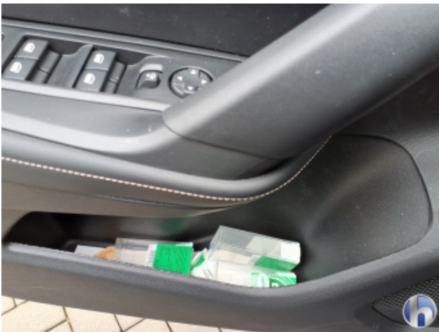
4. Verkleidung Verschmutzt - Reinigen