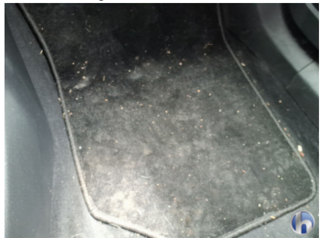
5. Fußraum Innenraum rechts vorne Verschmutzt - Reinigen