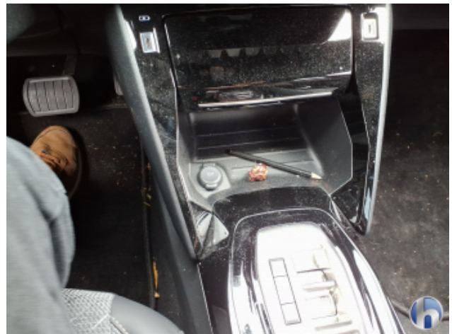
4. Verkleidung Verschmutzt - Reinigen