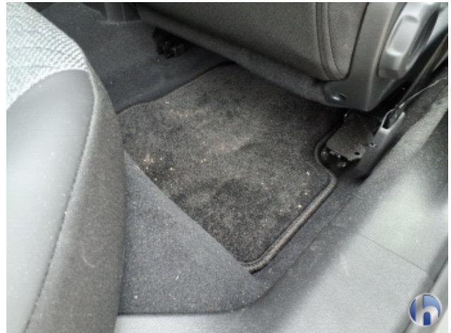
5. Fußraum Innenraum rechts vorne Verschmutzt - Reinigen