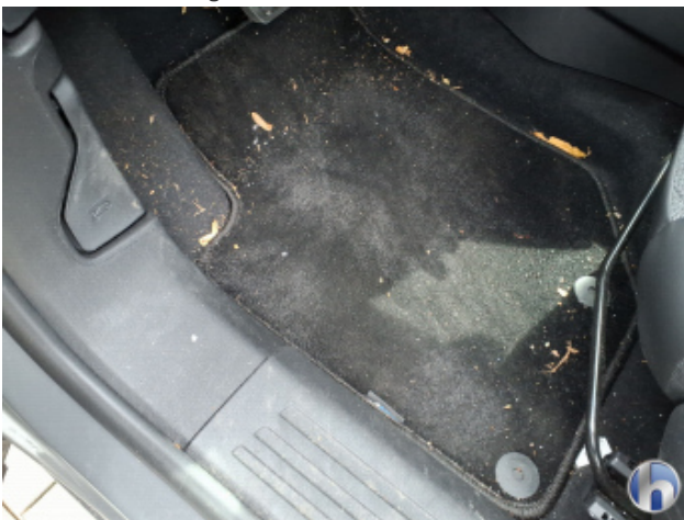
5. Fußraum Innenraum rechts vorne Verschmutzt - Reinigen