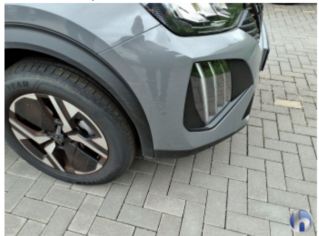
3. Stoßfänger Vorne Oberflächenkratzer - Aufbereiten / Polieren