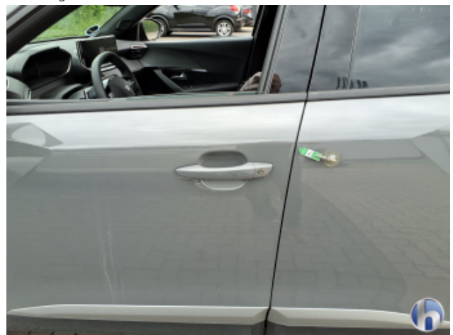
1. Tür Vorne - Links Kratzer - Smart Repair