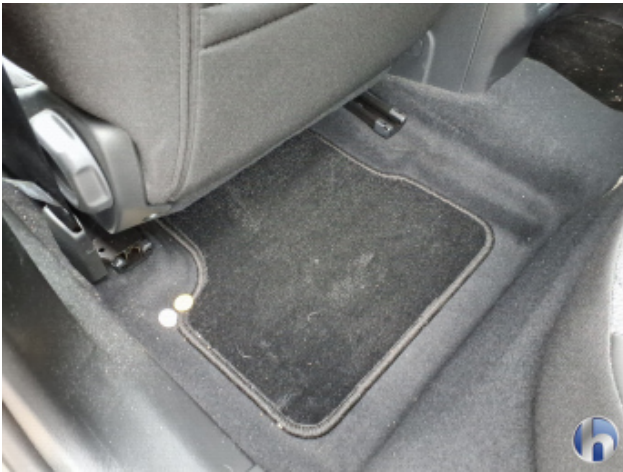
5. Fußraum Innenraum rechts vorne Verschmutzt - Reinigen