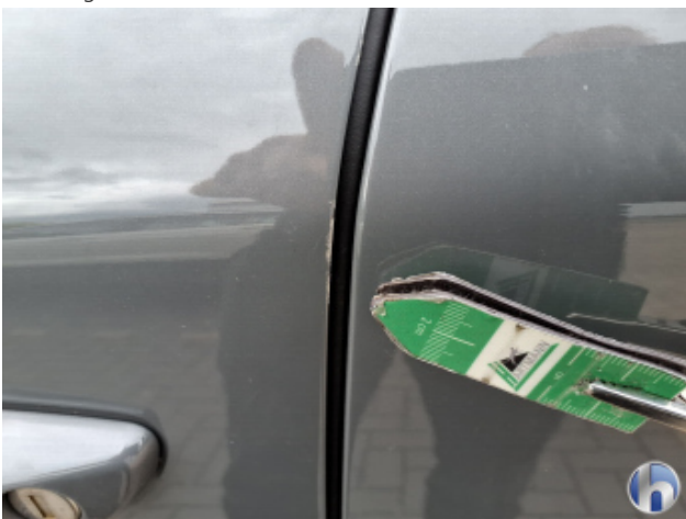
1. Tür Vorne - Links Kratzer - Smart Repair