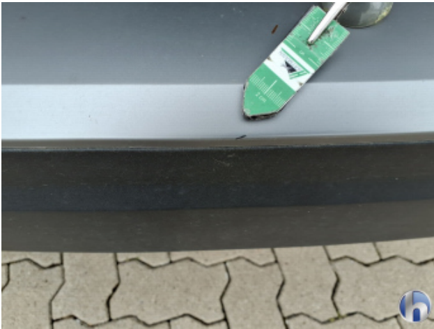
2. Stoßfänger Hinten Kratzer - Smart Repair