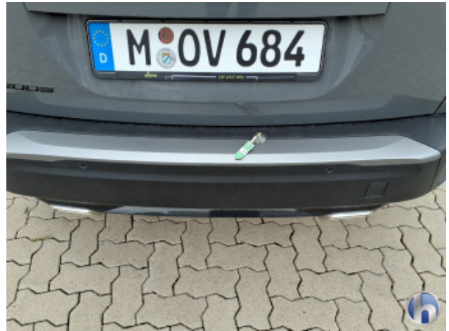
2. Stoßfänger Hinten Kratzer - Smart Repair