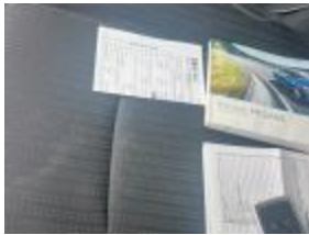
Consola central Agujero Reemplazar