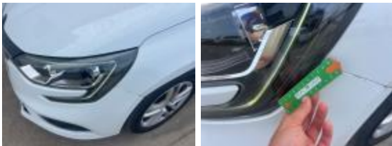
Paragolpes Delantero Rayado Reparar + Pintar