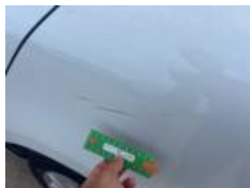
Puerta Tras Iz Rayado Reparar + Pintar