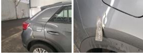
Aile AVD, Bosse(s), PDR - Débosselage ss peinture