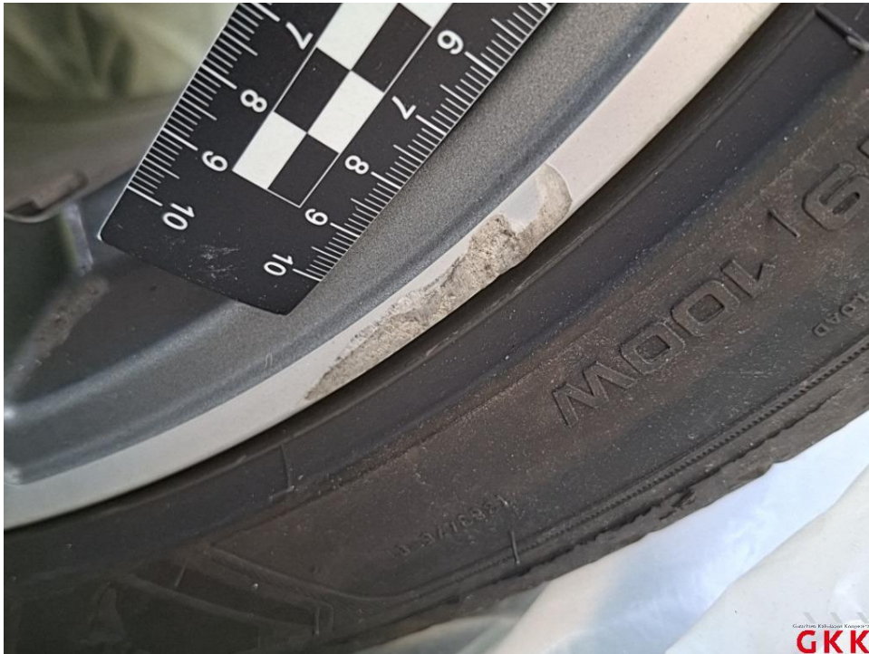
Bild 15. LM-Rad, 1 x beiliegend, Materialabtrag, ersetzen