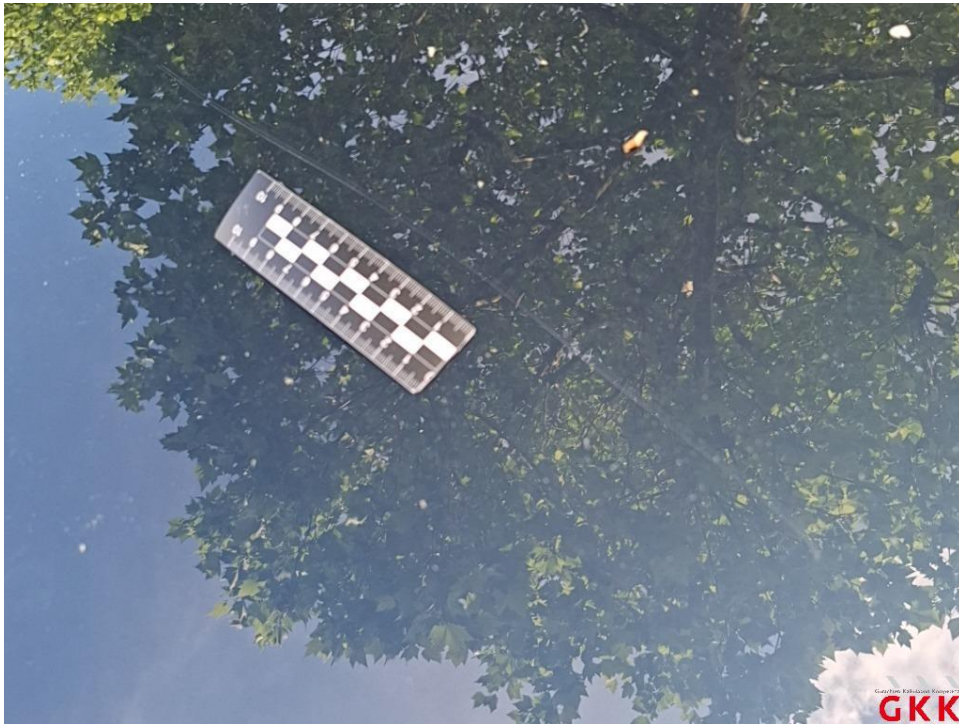
Bild 23. Motorhaube, verkratzt, lackieren