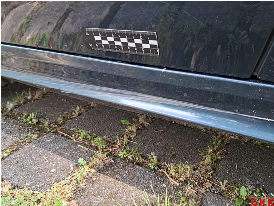
Bild 25. Schweller rechts, Abdeckung -lackiert-, beschädigt, ersetzen