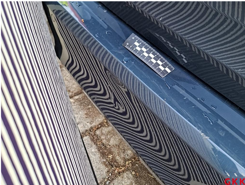
Bild 32. Stoßfänger hinten, Verkleidung -lackiert-, beschädigt, ersetzen