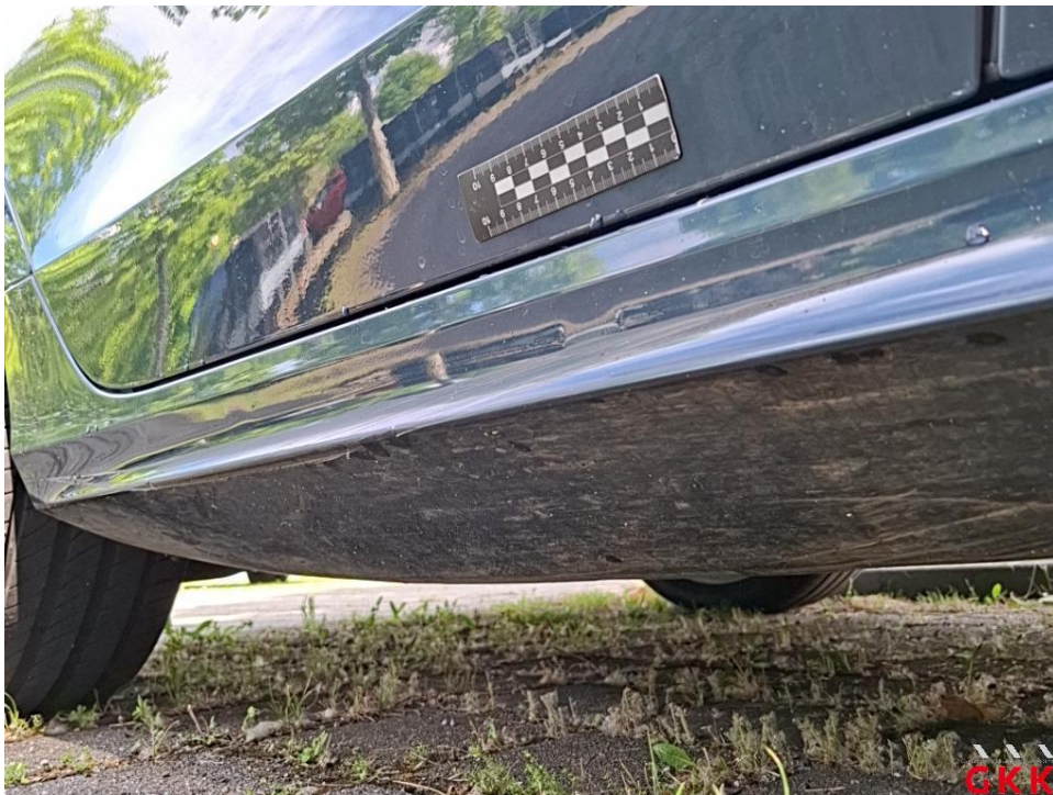
Bild 26. Schweller rechts, Abdeckung -lackiert-, beschädigt, ersetzen