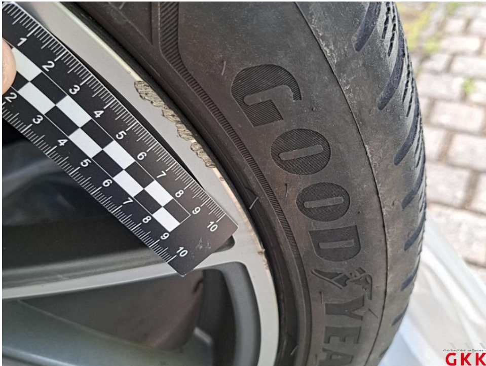
Bild 13. LM-Rad, 1 x beiliegend, Materialabtrag, ersetzen