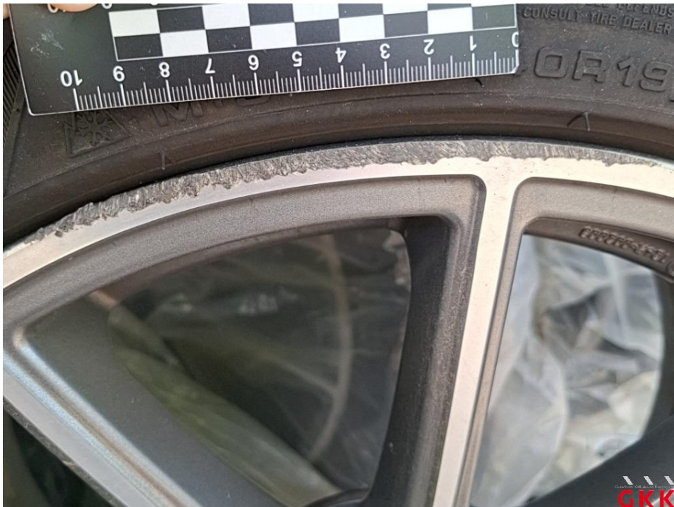
Bild 18. LM-Rad, 1 x beiliegend, Materialabtrag, ersetzen