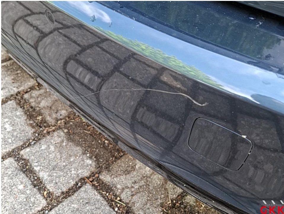
Bild 33. Stoßfänger hinten, Verkleidung -lackiert-, beschädigt, ersetzen