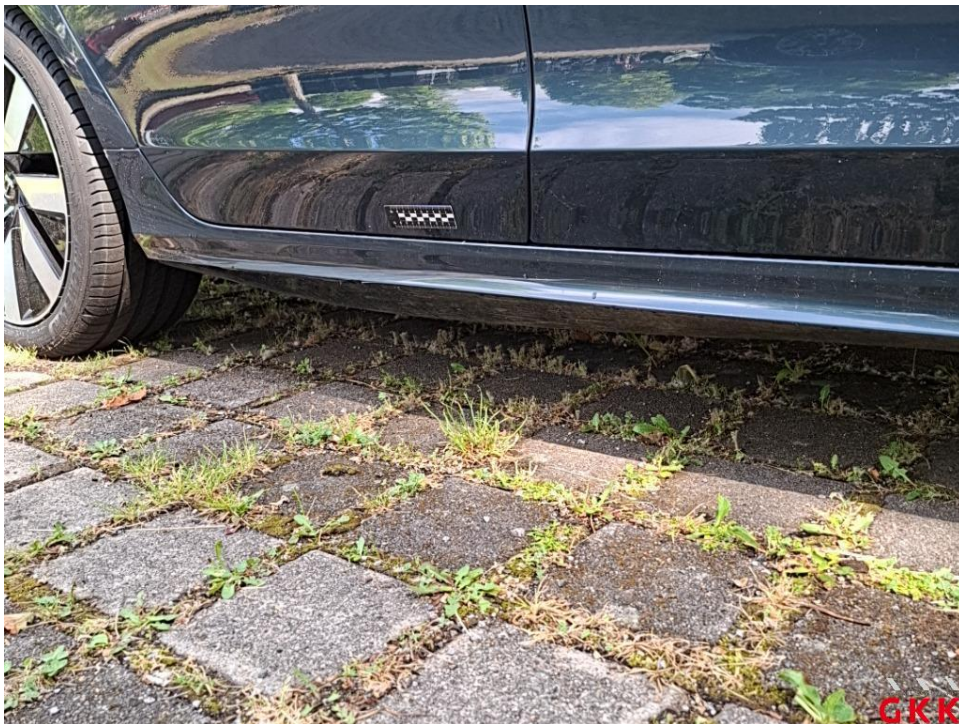
Bild 24. Schweller rechts, Abdeckung -lackiert-, beschädigt, ersetzen