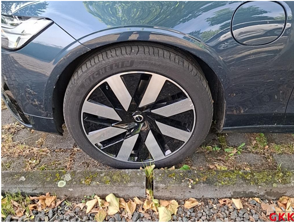
Bild 29. LM-Rad, vorne links, Materialabtrag, ersetzen