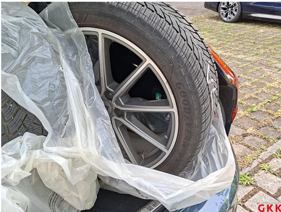
Bild 12. LM-Rad, 1 x beiliegend, Materialabtrag, ersetzen