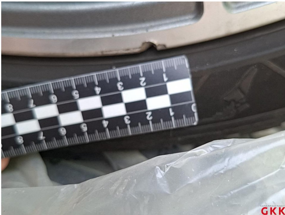
Bild 16. LM-Rad, 1 x beiliegend, Materialabtrag, ersetzen