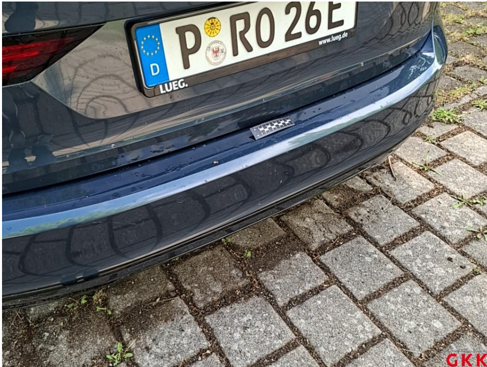
Bild 31. Stoßfänger hinten, Verkleidung -lackiert-, beschädigt, ersetzen