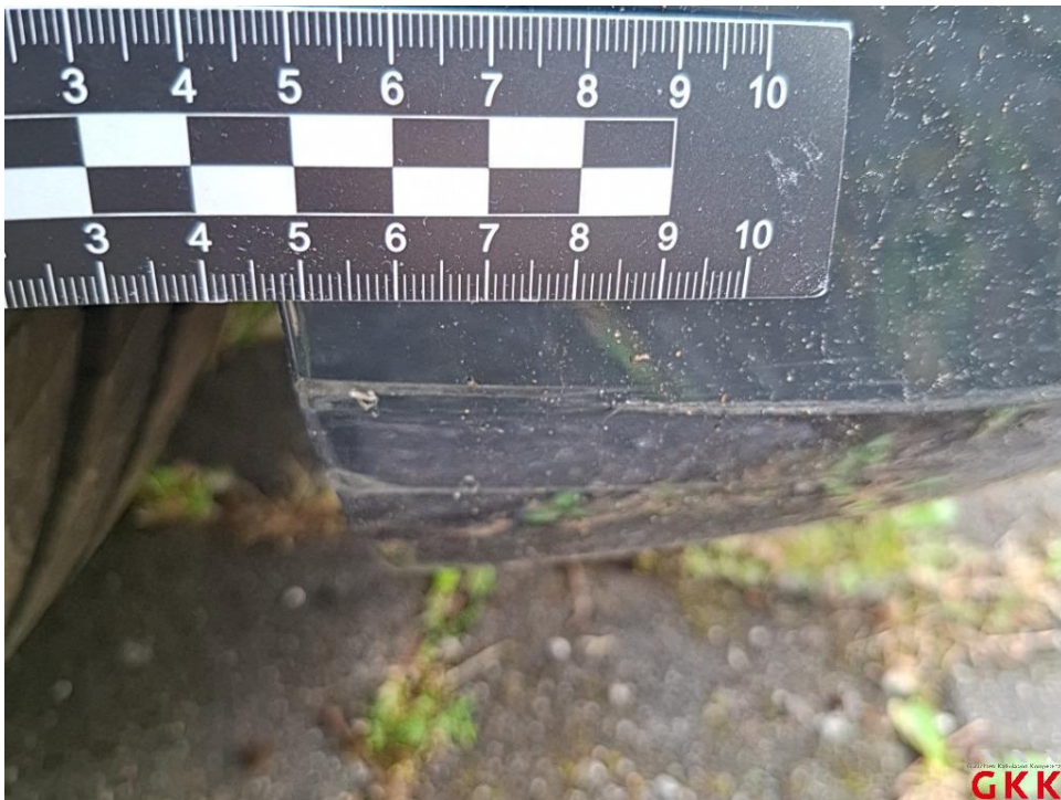
Bild 28. Stoßfänger vorne, Spoiler -lackiert-, verkratzt, lackieren