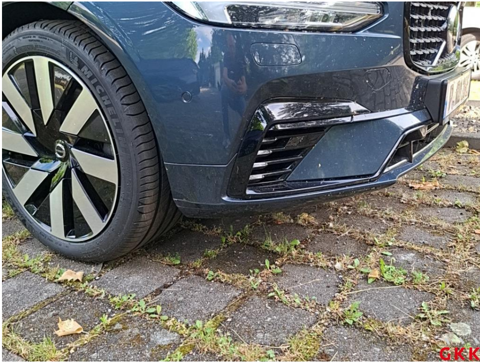
Bild 27. Stoßfänger vorne, Spoiler -lackiert-, verkratzt, lackieren