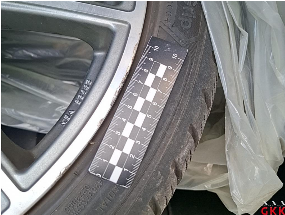
Bild 21. LM-Rad, 1 x beiliegend, Materialabtrag, ersetzen