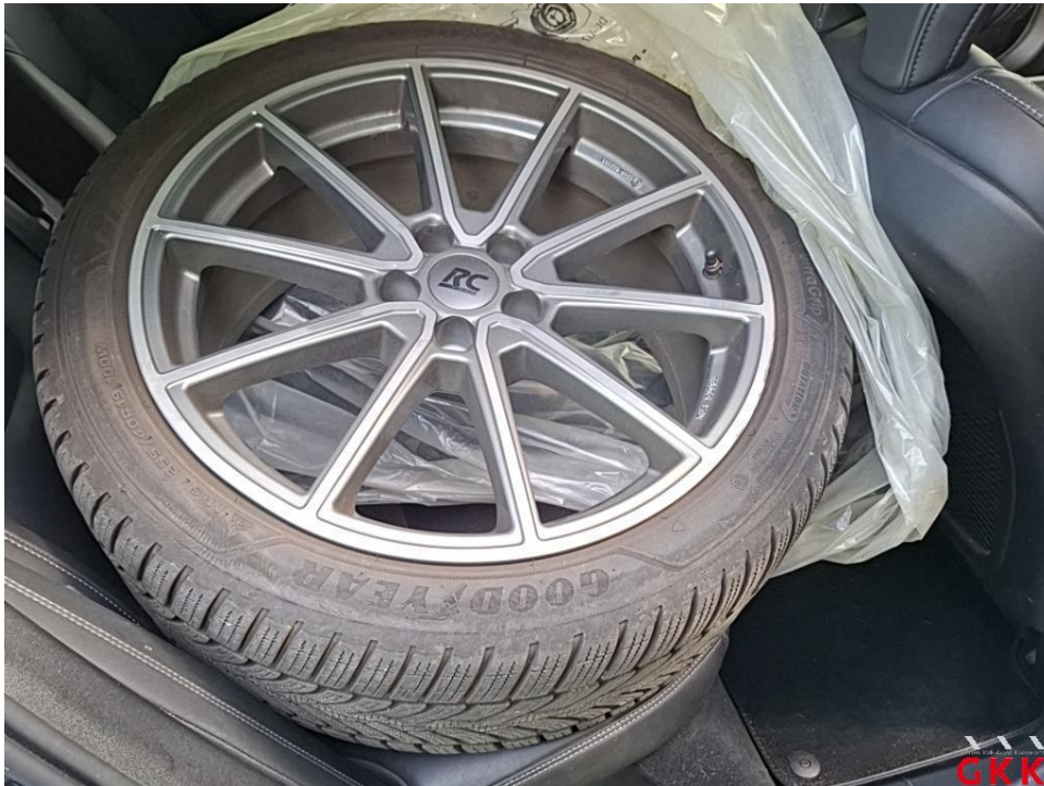
Bild 20. LM-Rad, 1 x beiliegend, Materialabtrag, ersetzen