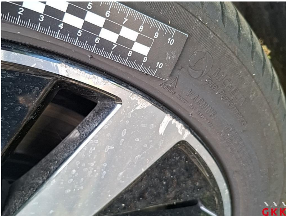
Bild 30. LM-Rad, vorne links, Materialabtrag, ersetzen