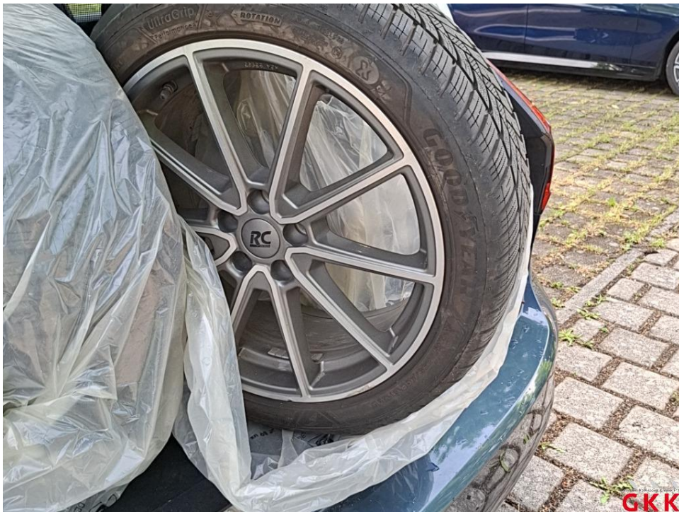
Bild 14. LM-Rad, 1 x beiliegend, Materialabtrag, ersetzen