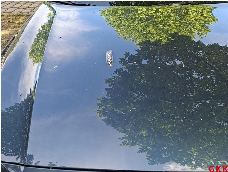
Bild 22. Motorhaube, verkratzt, lackieren