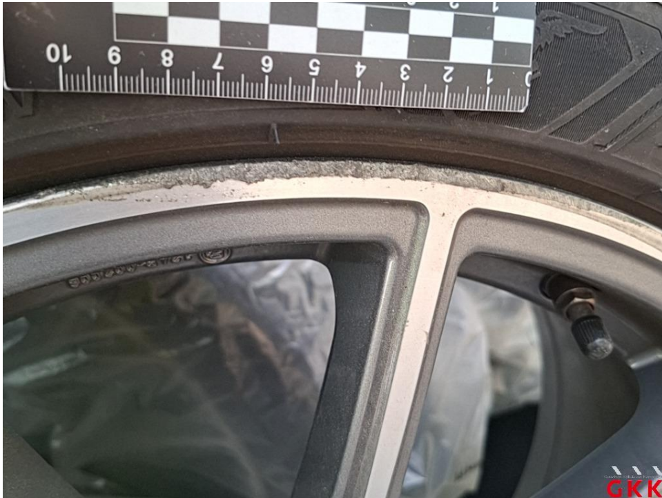
Bild 19. LM-Rad, 1 x beiliegend, Materialabtrag, ersetzen