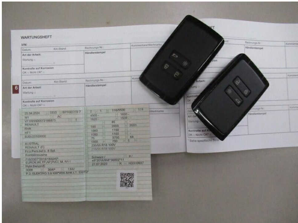
Bild 8 : Alle Fz-Schlüssel, ZLB 1, Letzter Eintrag im Serviceheft