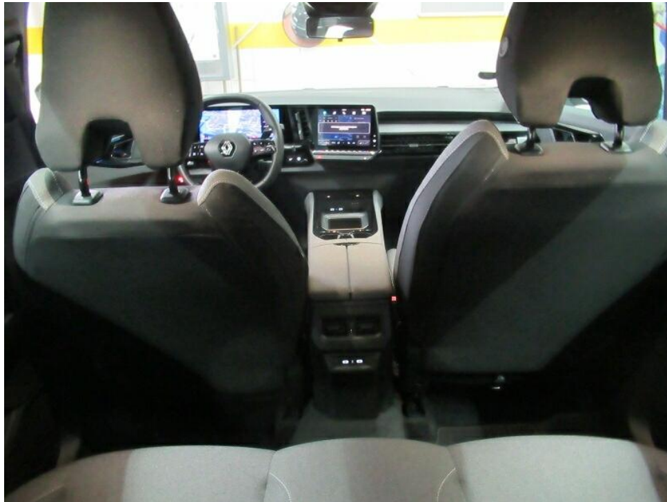
Bild 7 : Mittelkonsole des Rücksitzes (Radio/Navigation eingeschaltet)