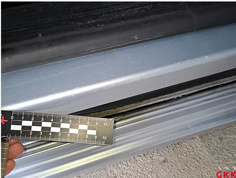
Bild 14. Tür hinten links, Einstieg, beschädigt, Smartrepair