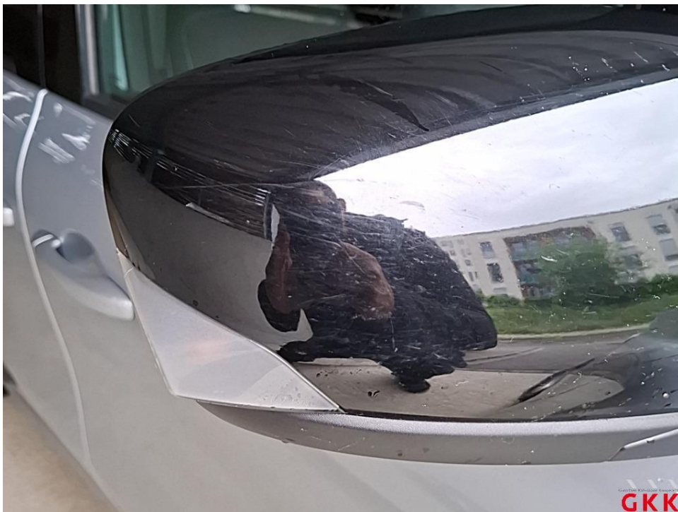
Bild 20. Spiegelgehäuse rechts, Blende -lackiert-, verkratzt, Smartrepair