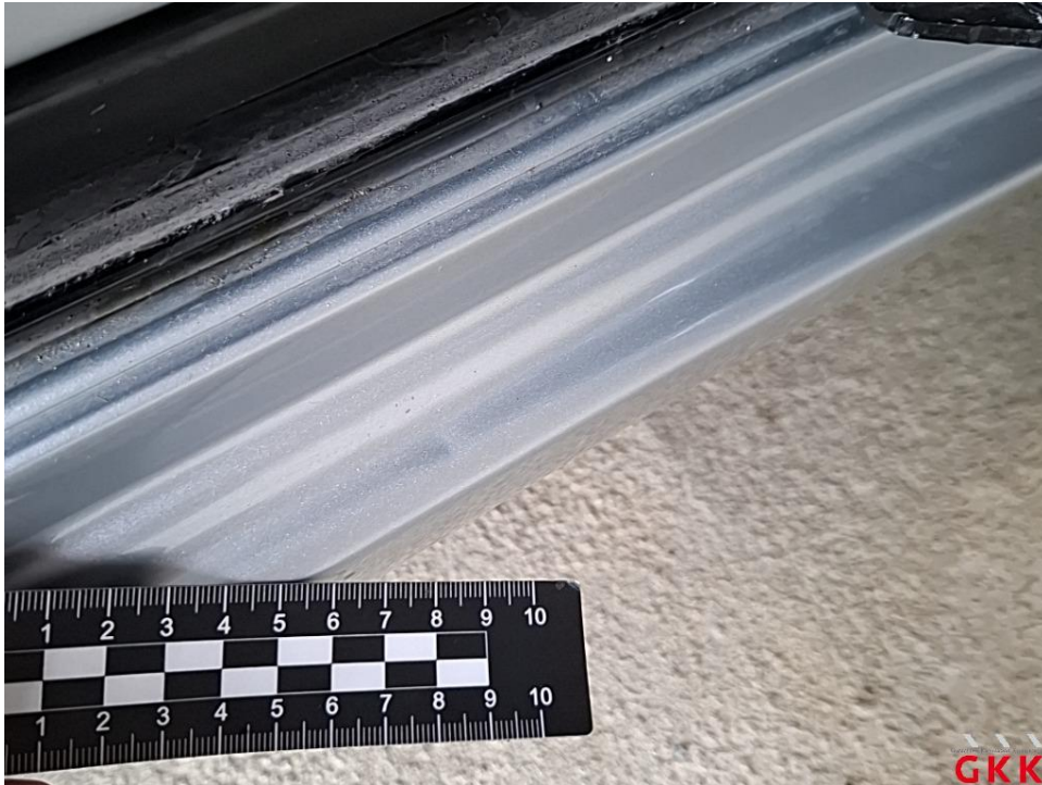
Bild 15. Tür hinten links, Einstieg, beschädigt, Smartrepair