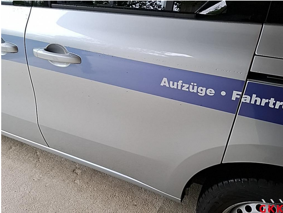
Bild 17. Beschriftungs- / Werbefolie, beklebt, entkleben