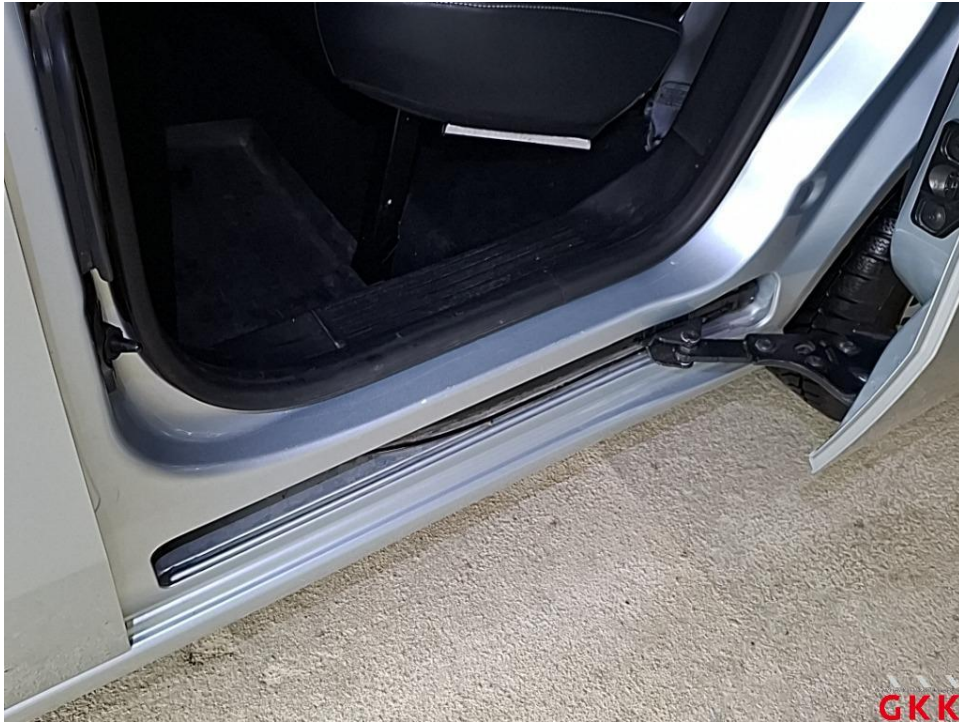
Bild 13. Tür hinten links, Einstieg, beschädigt, Smartrepair