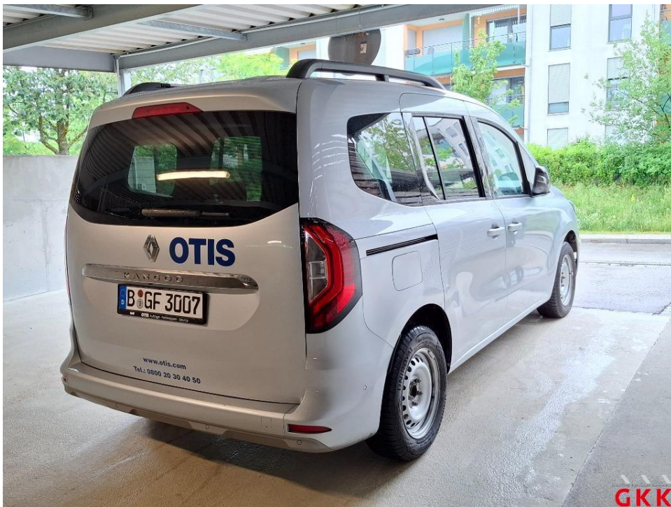
Bild 18. Beschriftungs- / Werbefolie, beklebt, entkleben