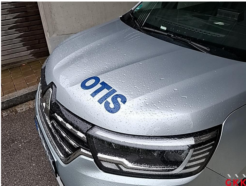
Bild 16. Beschriftungs- / Werbefolie, beklebt, entkleben