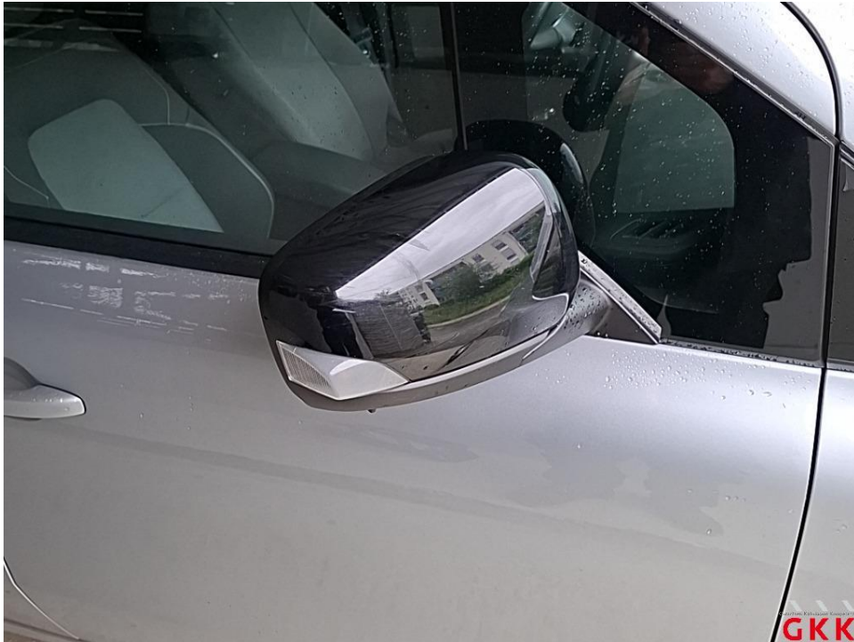
Bild 19. Spiegelgehäuse rechts, Blende -lackiert-, verkratzt, Smartrepair