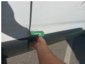
Puerta Deslizante DR Rayado Pintar