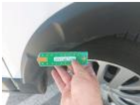
Puerta Tras Dr Rayado Pintar