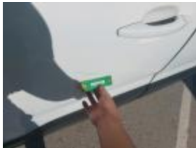
Embelecedor Aleta Tras DR Rayado Pintar