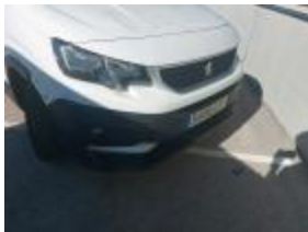
Moldura Aleta DEL DR Rayado Pintar