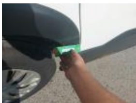
Panel Tras Dr Rayado Pintar