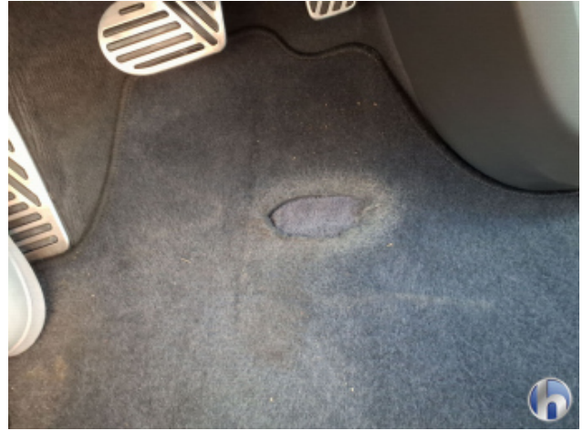
2. Fußmatte Fahrer Beschädigt - Erneuern