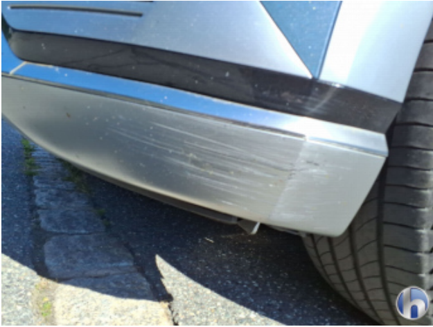
1. Frontspoiler Abschürfung - Lackieren