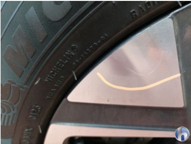
5. Felge Hinten - Rechts Kratzer - Smart Repair