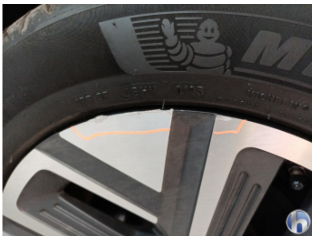
4. Felge Vorne - Rechts Beschädigt - Smart Repair