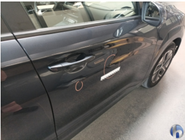
1. Tür Vorne - Rechts Delle - Sanft Instandsetzen