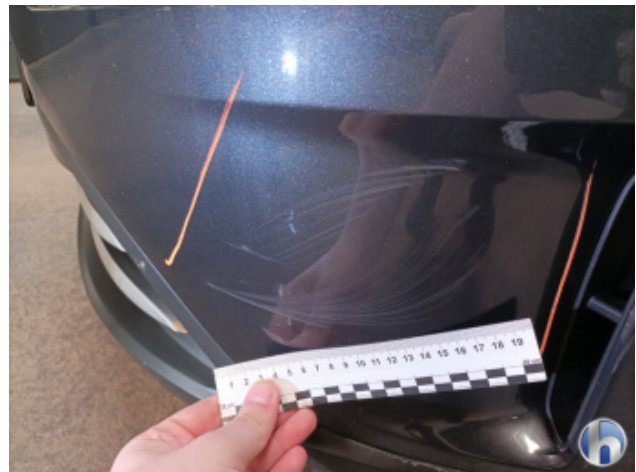
3. Stoßfänger Vorne Kratzer - Lackieren