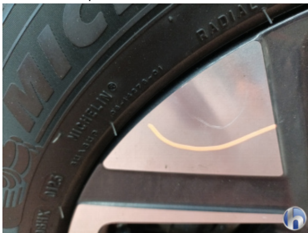
5. Felge Hinten - Rechts Kratzer - Smart Repair