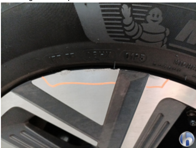
4. Felge Vorne - Rechts Beschädigt - Smart Repair