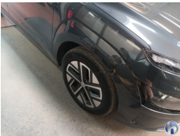
4. Felge Vorne - Rechts Beschädigt - Smart Repair