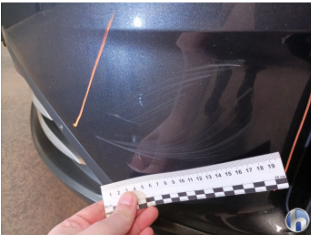
3. Stoßfänger Vorne Kratzer - Lackieren