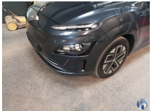
3. Stoßfänger Vorne Kratzer - Lackieren