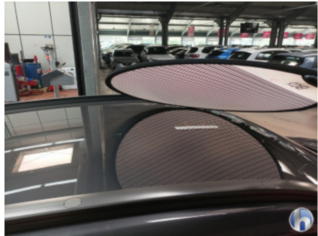
2. Dach Delle - Sanft Instandsetzen