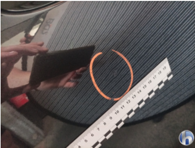
1. Tür Vorne - Rechts Delle - Sanft Instandsetzen