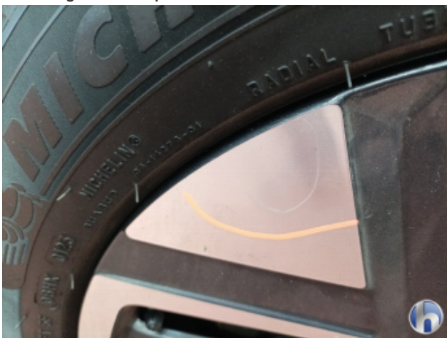
5. Felge Hinten - Rechts Kratzer - Smart Repair