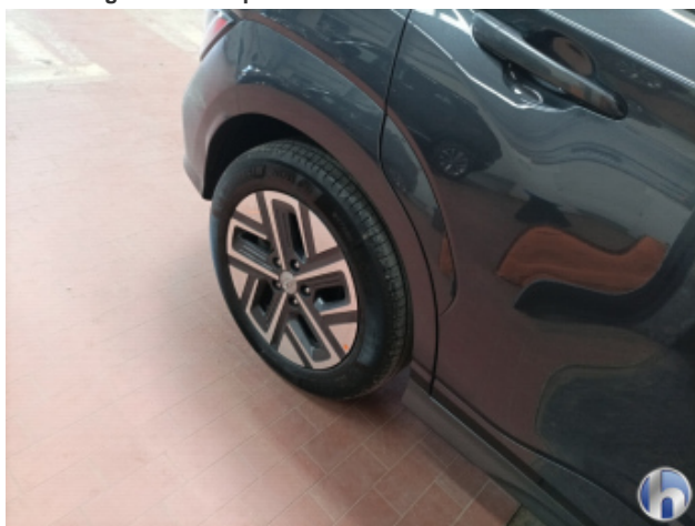
5. Felge Hinten - Rechts Kratzer - Smart Repair