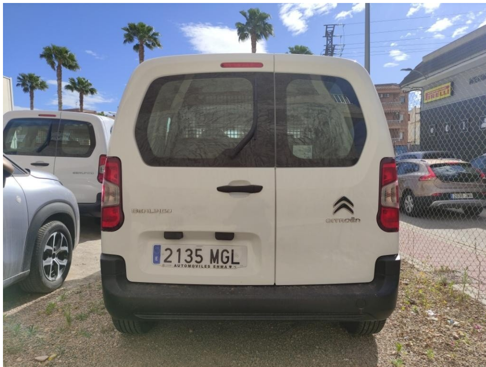
5. Fotos Exteriores