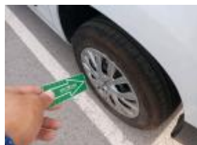
Kit reparación Neumático Falta Importe