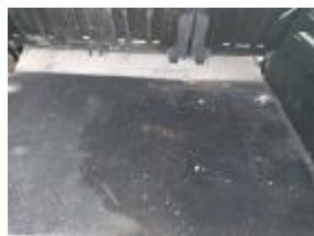
Guarnic int IZ maletero Rayado Reemplazar