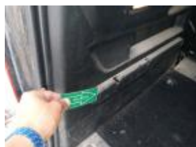
Guarnic int DER maletero Rayado Reemplazar