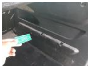
Moqueta maletero Daño Químico Limpieza Química