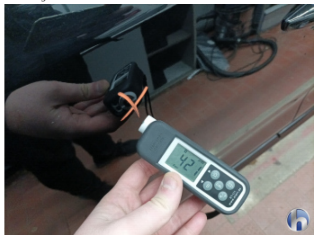
1. Tür Vorne - Links Nachlackiert - Ohne Reparatur