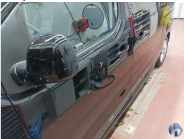
1. Tür Vorne - Links Nachlackiert - Ohne Reparatur