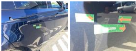
Jupe AR, Griffe(s), Acceptable