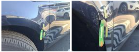
Aile ARG, Bosse(s), LI - Réparer et peindre (complet)