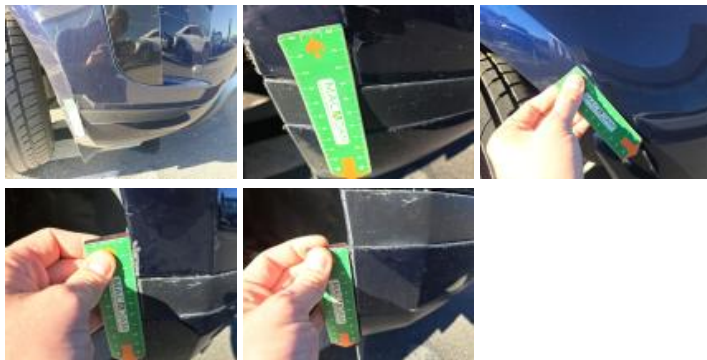
Moulure de pare-chocs AVD, Griffe(s), Acceptable