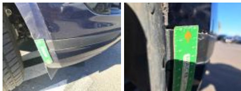
Porte ARD, Griffe(s), Lustrage