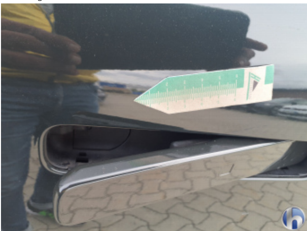
1. Tür Vorne - Rechts Kratzer - Smart Repair