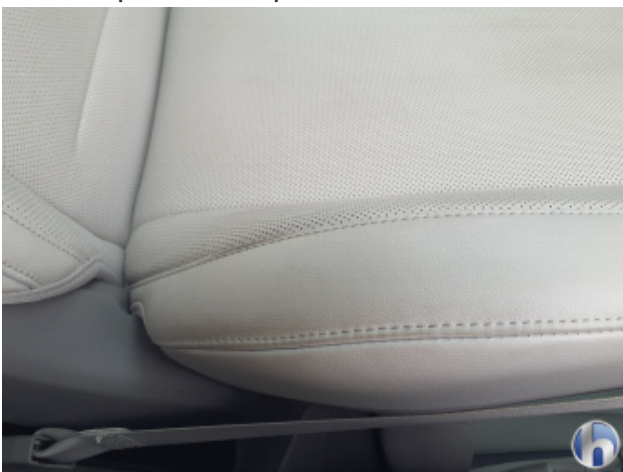
6. Sitz Innenraum links vorne Verschmutzt - Reinigen