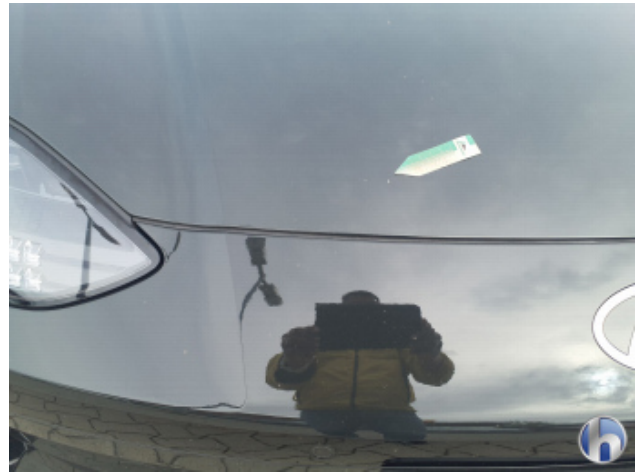
4. Motorhaube Gebrauchsspuren - Ohne Reparatur