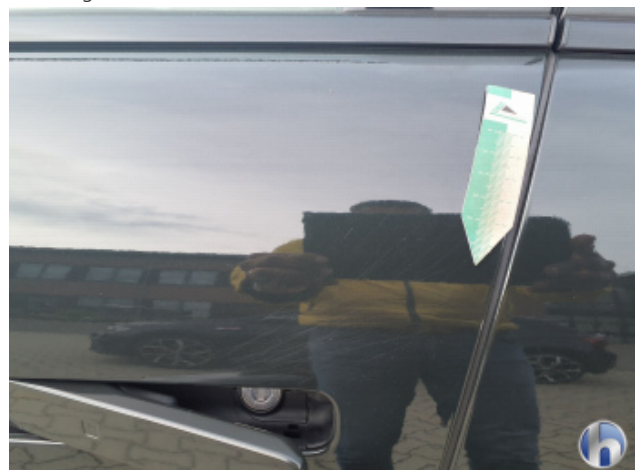
2. Tür Vorne - Links Oberflächenkratzer - Aufbereiten / Polieren