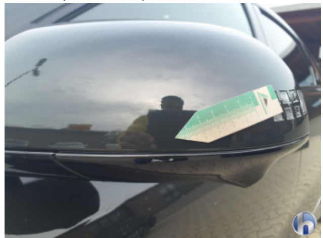
5. Außenspiegel Gehäuse - Links Kratzer - Smart Repair