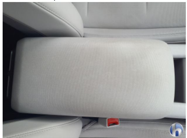
6. Sitz Innenraum links vorne Verschmutzt - Reinigen