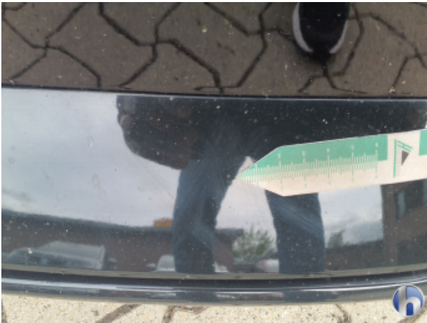
3. Stoßfänger Vorne Steinschlag - Lackieren