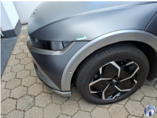
2. Motorhaube Steinschlag - Smart Repair