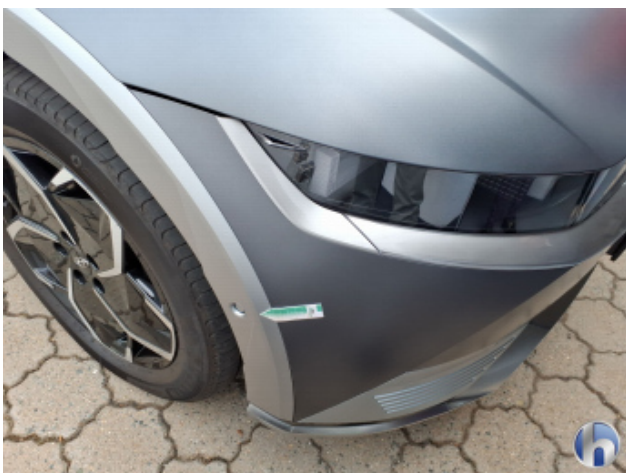
3. Kotflügel Vorne - Rechts Steinschlag - Smart Repair