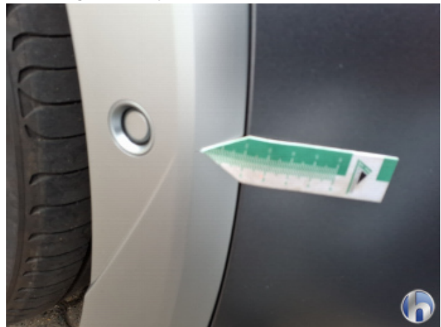
3. Kotflügel Vorne - Rechts Steinschlag - Smart Repair