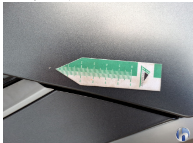
2. Motorhaube Steinschlag - Smart Repair