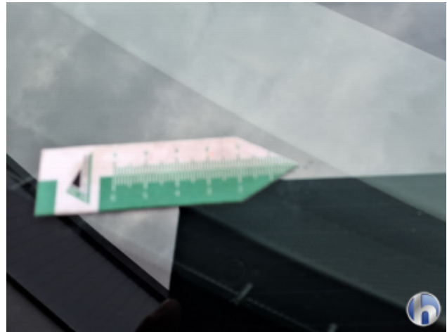
1. Windschutzscheibe Steinschlag - Smart Repair