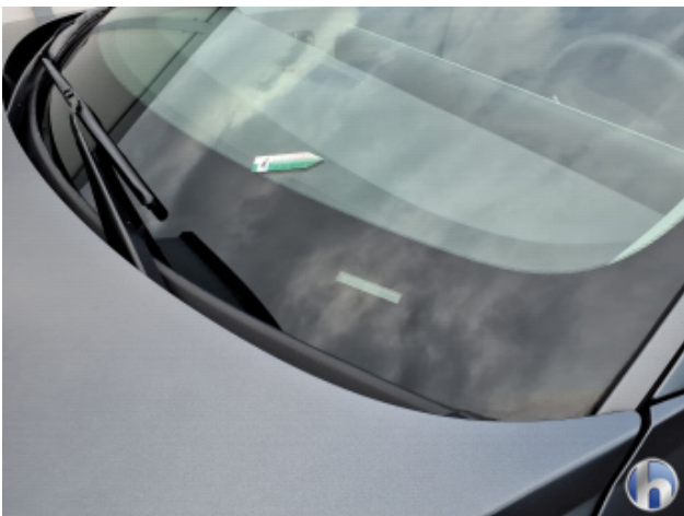
1. Windschutzscheibe Steinschlag - Smart Repair