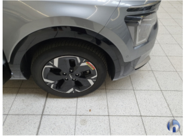
1. Felge Vorne - Rechts Gebrauchsspuren - Ohne Reparatur