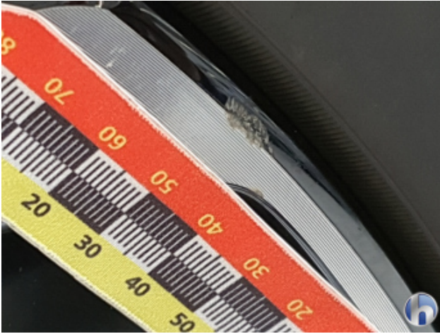
1. Felge Vorne - Rechts Gebrauchsspuren - Ohne Reparatur