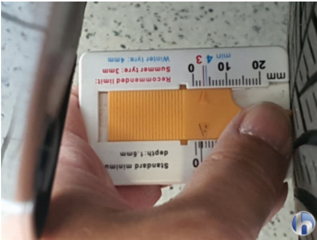
4. Reifen Vorne - Links Nicht Verkehrssicher - Erneuern