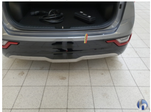
2. Stoßfänger Hinten Gebrauchsspuren - Ohne Reparatur