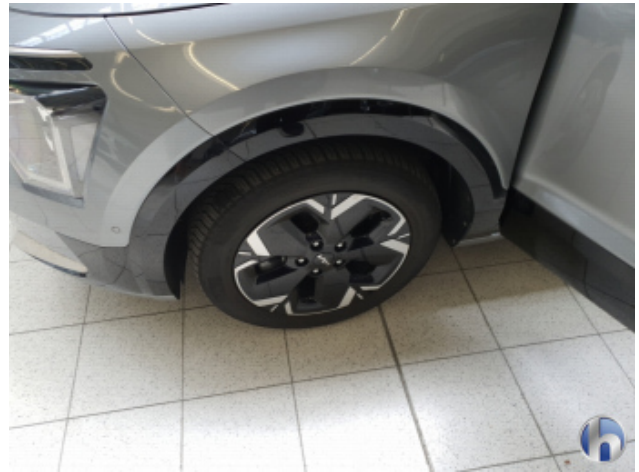
4. Reifen Vorne - Links Nicht Verkehrssicher - Erneuern