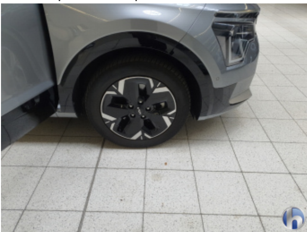
3. Reifen Vorne - Rechts Nicht Verkehrssicher - Erneuern