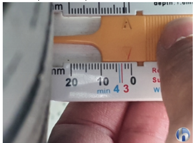
3. Reifen Vorne - Rechts Nicht Verkehrssicher - Erneuern