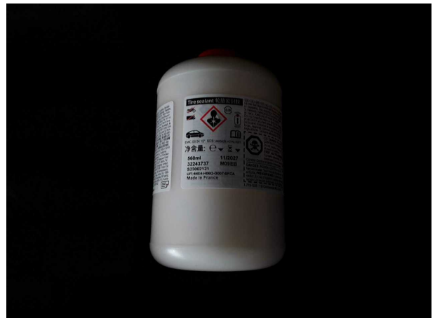
Abbildung 18: Sonstiges