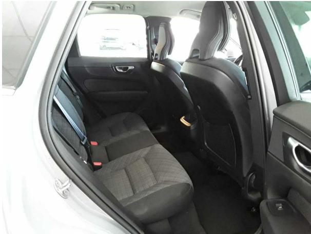
Abbildung 13: Innenraum hinten