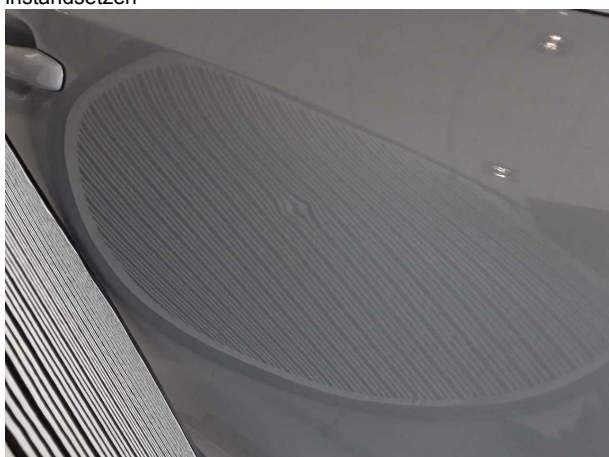
Beschädigung #1: Tür hinten rechts: Tür - Delle(n) - sanft instandsetzen