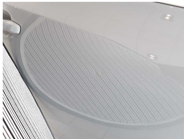
Beschädigung #1: Tür hinten rechts: Tür - Delle(n) - sanft instandsetzen