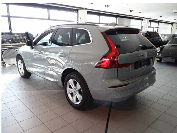
Abbildung 3: Schräg hinten