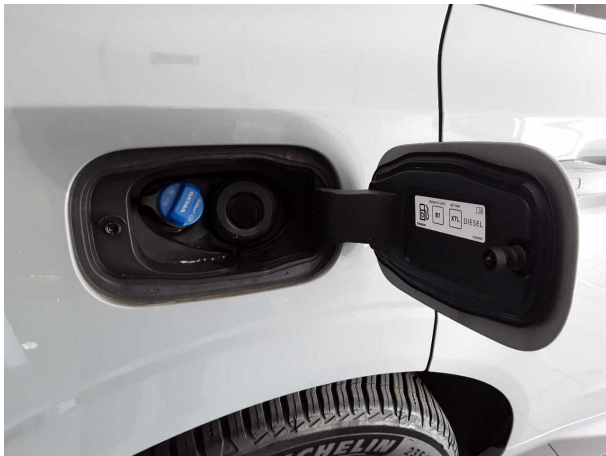
Abbildung 15: Ladebuchse/Tankstutzen