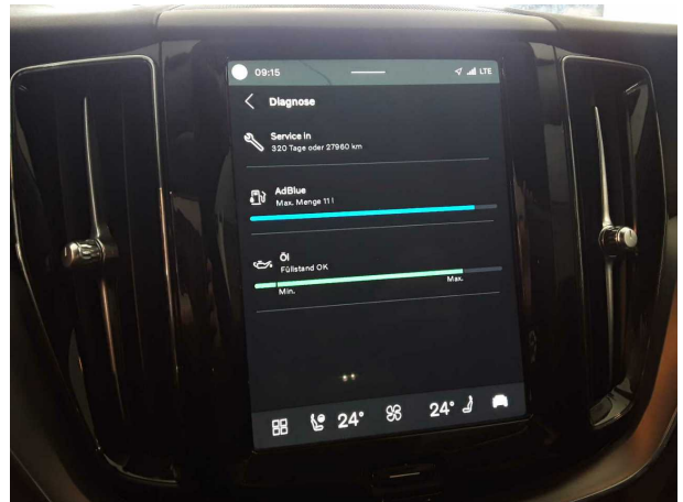
Abbildung 16: Sonstiges