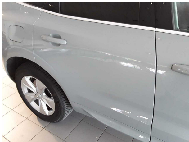
Beschädigung #1: Tür hinten rechts: Tür - Delle(n) - sanft instandsetzen