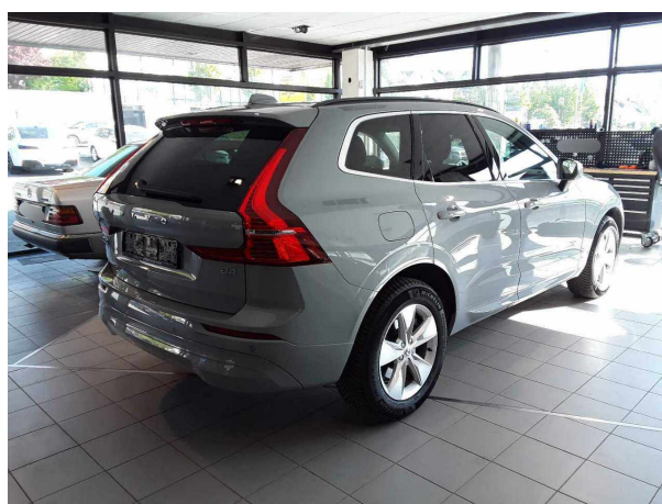
Abbildung 4: Schräg hinten