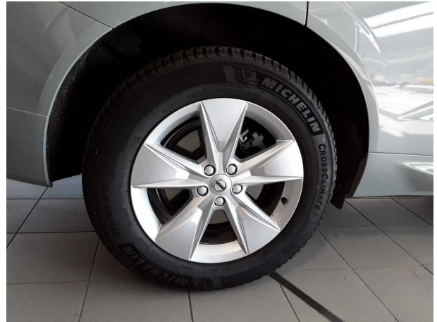
Abbildung 14: Montierte Bereifung