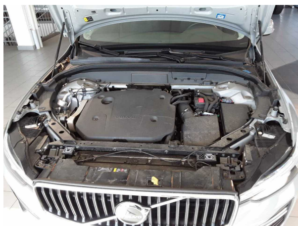
Abbildung 6: Motorraum