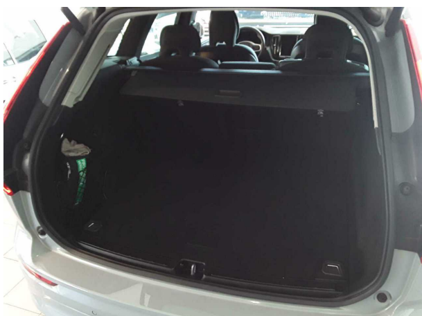
Abbildung 5: Laderaum