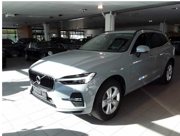
Abbildung 2: Schräg vorne