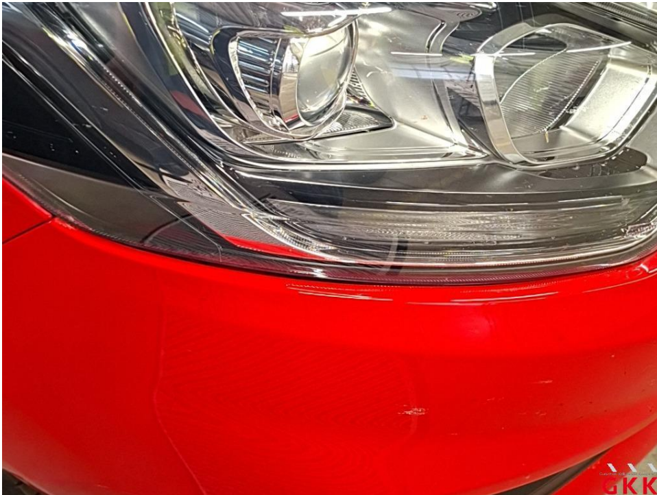
Bild 17 Stoßfänger vorne, Spaltmaß fehlerhaft, prüfen