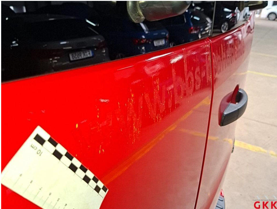
Bild 23 Beschriftungs- / Werbefolie, Klebreste, entfernen