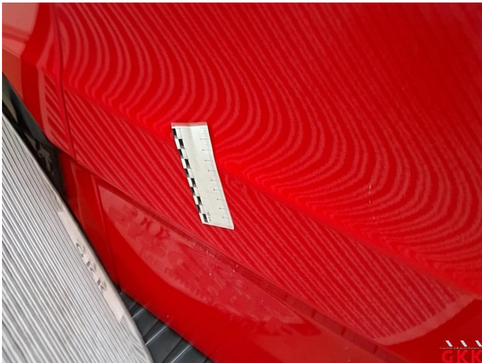
Bild 28 Hecktür rechts, unterhalb, beschädigt, instand setzen - lackieren