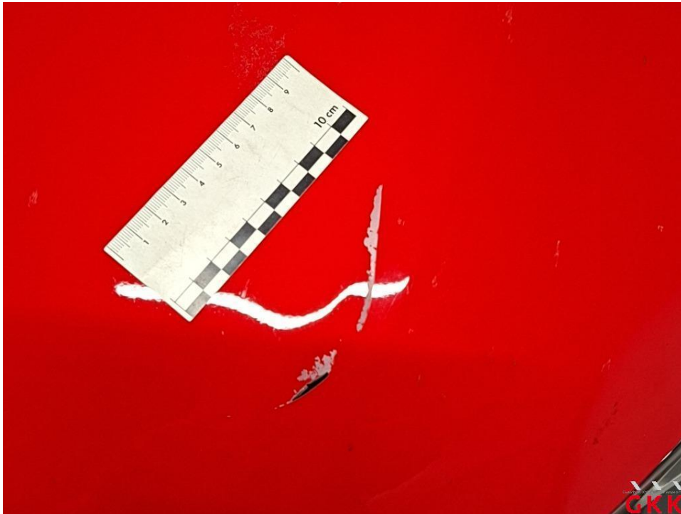
Bild 21 Beschriftungs- / Werbefolie, Klebreste, entfernen