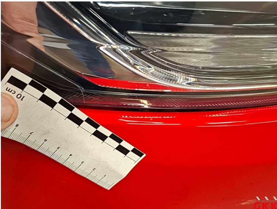
Bild 18 Stoßfänger vorne, Spaltmaß fehlerhaft, prüfen