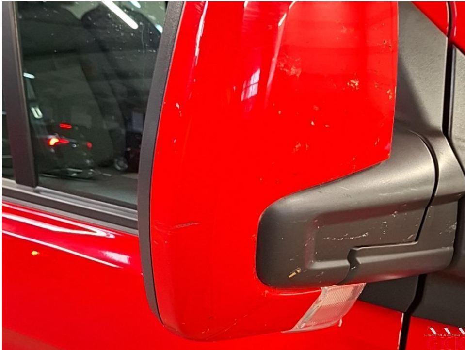
Bild 19 Spiegelgehäuse rechts, Kappe -lackiert-, verkratzt, lackieren