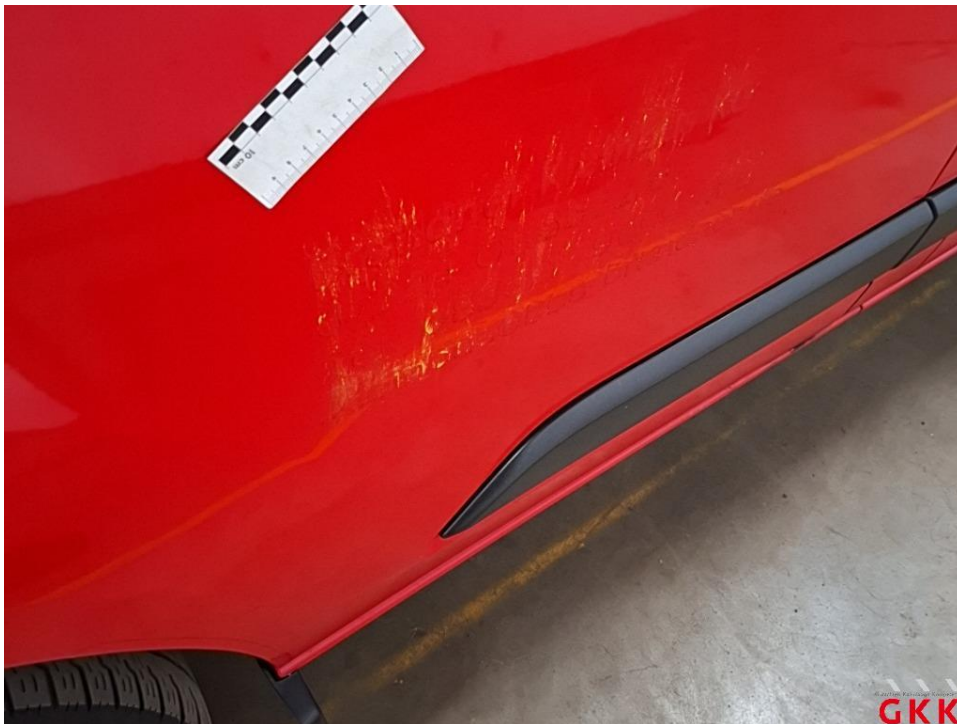
Bild 22 Beschriftungs- / Werbefolie, Klebreste, entfernen