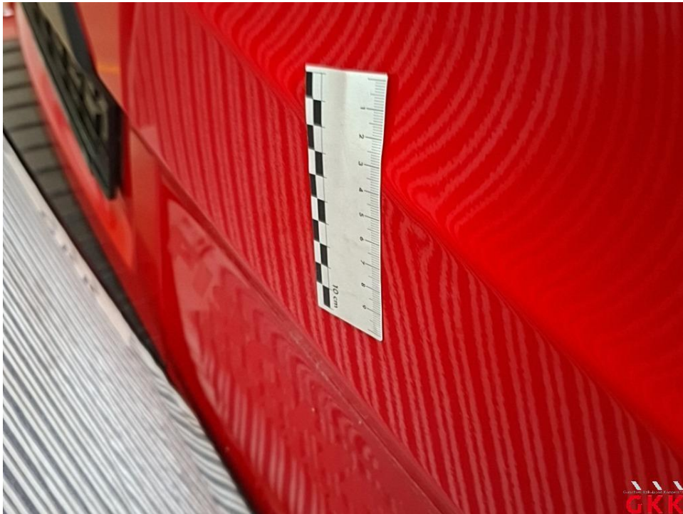
Bild 29 Hecktür rechts, unterhalb, beschädigt, instand setzen - lackieren