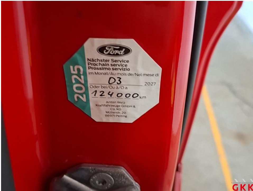
Bild 15 Inspektion groß, Transporter, kein gültiger Nachweis vorhanden, durchführen