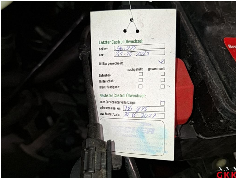
Bild 16 Inspektion groß, Transporter, kein gültiger Nachweis vorhanden, durchführen