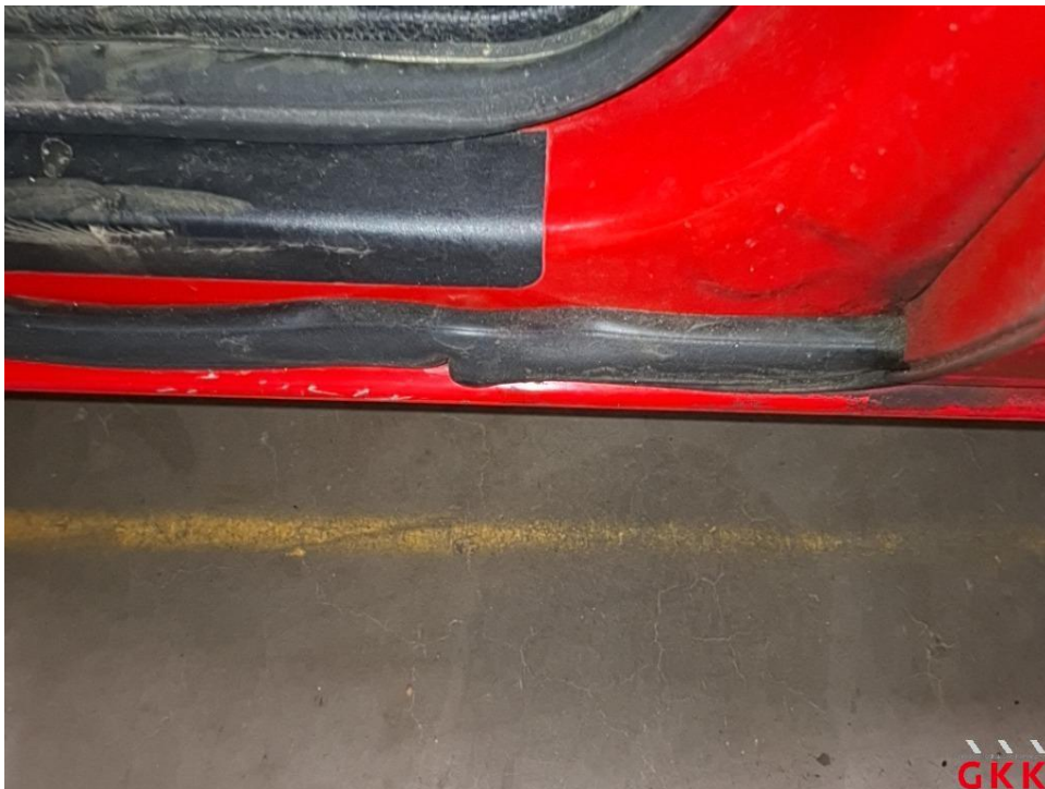
Bild 26 Tür vorne links, Dichtung -Einstieg-, beschädigt, ersetzen