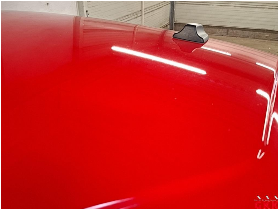
Bild 25 Fahrzeug, außen, Lackierung verwittert / matt, aufbereiten