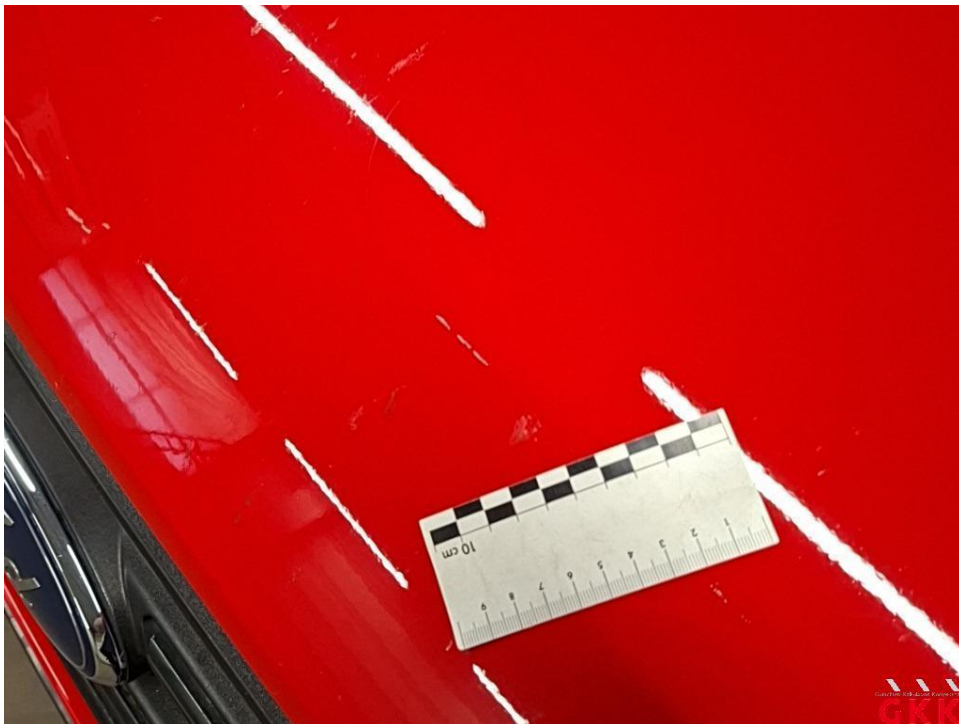
Bild 24 Fahrzeug, außen, Lackierung verwittert / matt, aufbereiten