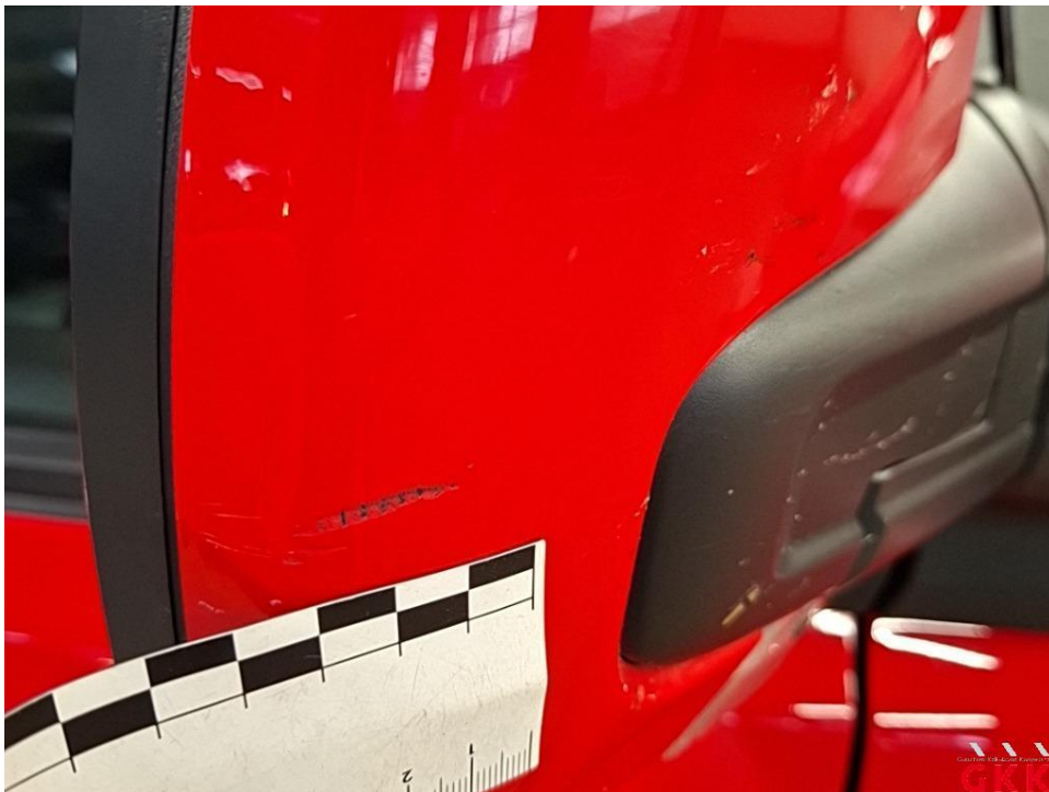
Bild 20 Spiegelgehäuse rechts, Kappe -lackiert-, verkratzt, lackieren