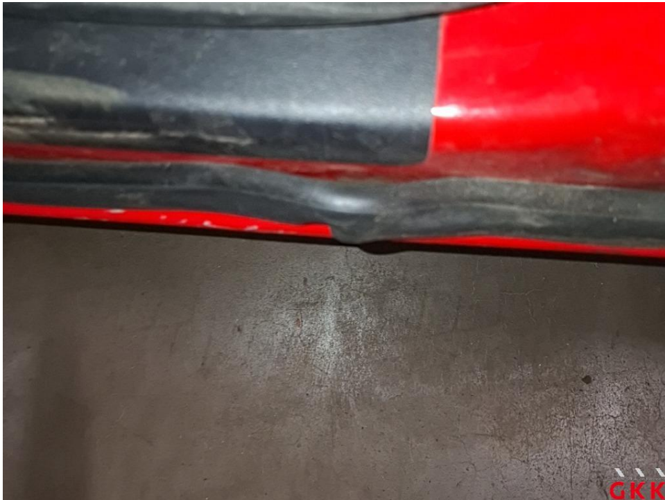
Bild 27 Tür vorne links, Dichtung -Einstieg-, beschädigt, ersetzen